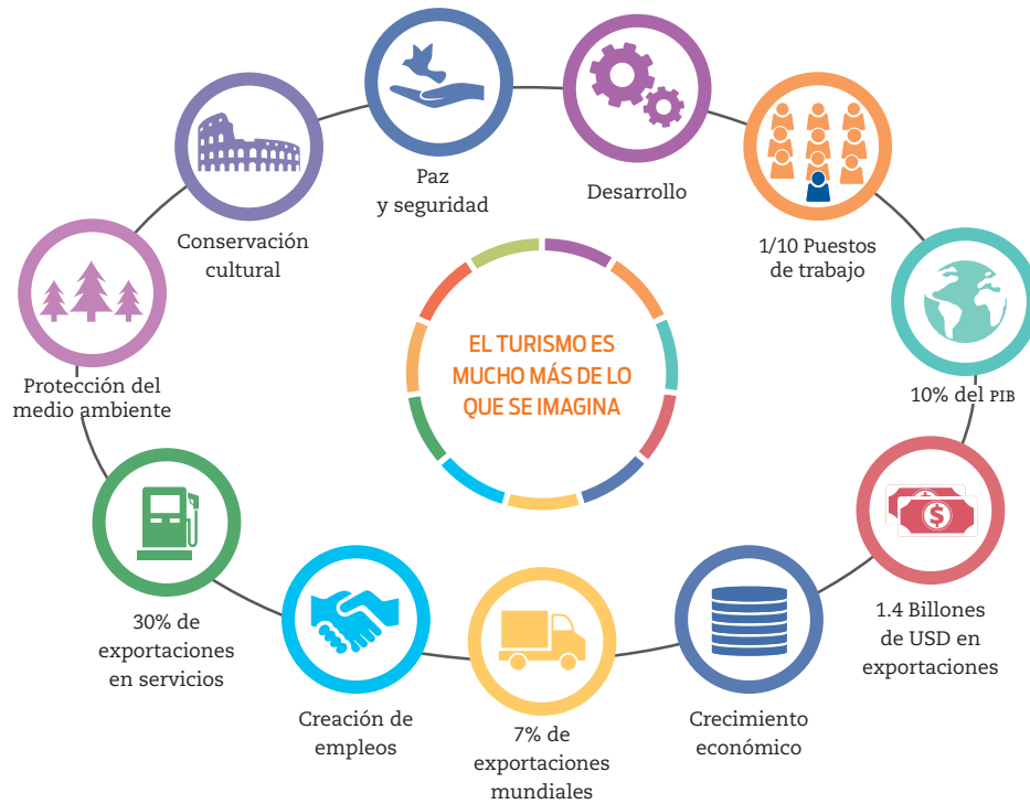
Figura 2.46 La Asamblea General de las Naciones Unidas declaró 2017 como el Año Internacional del Turismo Sostenible para el Desarrollo; a través de la Organización Mundial del Turismo aboga por un turismo que contribuya al crecimiento económico, a un desarrollo incluyente y a la sostenibilidad ambiental.