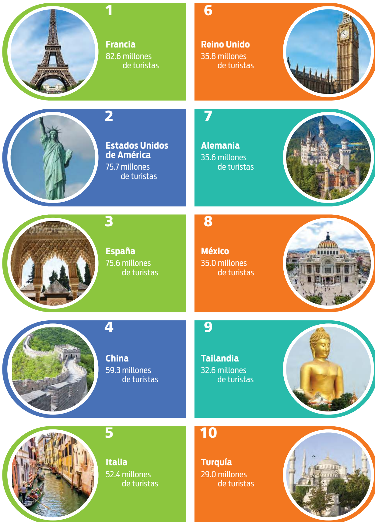
Tabla 2.13 Diez principales destinos turísticos en el mundo por llegada de turistas (2016)

Fuente: Adaptado con base en datos de la OMT (2016).