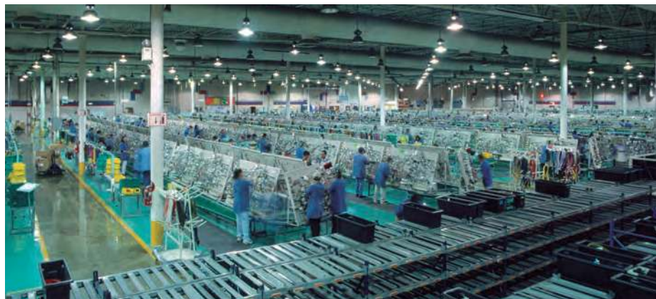
Figura 2.39 La ciudad de Monterrey, Nuevo León, se caracteriza por su importante actividad industrial.

Dispersión geográfica de los núcleos de actividad de una empresa o población.