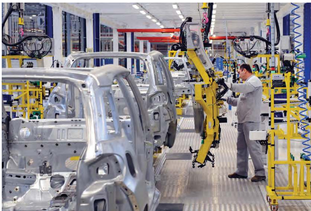
Figura 2.40 Empresas transnacionales realizan cada etapa del proceso productivo de un automóvil en distintos países del mundo. ¿De dónde crees que extraen el acero o el caucho?

Los productos son diseñados en los países desarrollados donde tienen su sede las transnacionales mientras que las materias primas se extraen de países con bajo desarrollo en los que su explotación es muy barata. Después, algunas de las partes del producto se elaboran en países de desarrollo medio. Luego, son armados y ensamblados en lugares donde la mano de obra es barata, abundante y calificada, como nuestro país (figura 2.40). Por último, los productos se venden en países de alta concentración de población con suficiente poder adquisitivo, es decir, en países de desarrollo medio, como el nuestro.