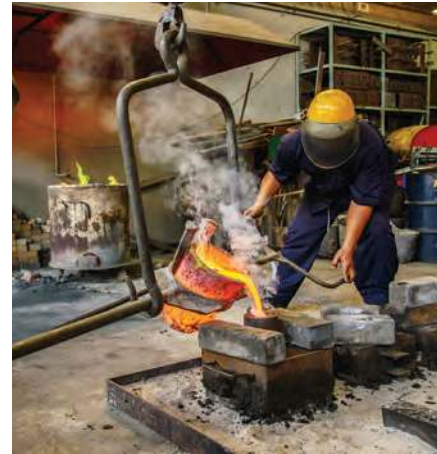
Figura 2.38 La industria siderúrgica en México es una importante fuente de generación de productos y empleos, y receptora de inversiones.

Observa el audiovisual La industrialización para que conozcas sus etapas, los factores de su localización, así como las consecuencias y cambios en el espacio geográfico.