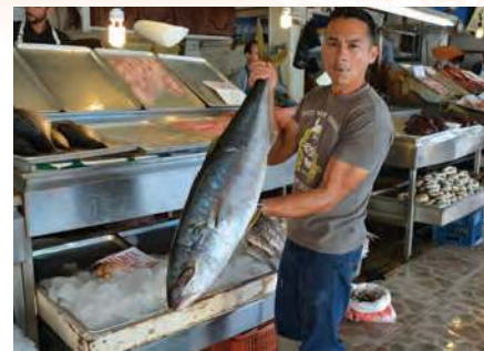
Figura 1.2 Sonora, Sinaloa, Baja California y Baja California Sur tienen la mayor producción pesquera. Durango y Chihuahua sobresalen en producción forestal.