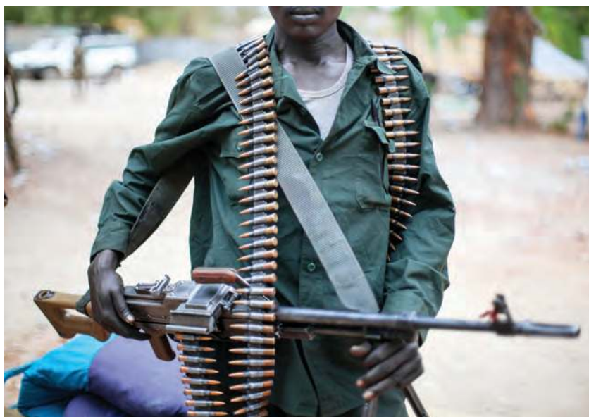
Figura 2.24 Sudán del Sur es un país de reciente creación. Desde 2013 está inmerso en una guerra civil que comenzó con un golpe de Estado. La corrupción generalizada, la pobreza, la desigualdad, la división étnica y las ambiciones políticas y económicas son las causas del conflicto.

Si tienen acceso a internet, entren al recurso La guerra por el agua , donde encontrarán una historieta interactiva sobre un conflicto territorial provocado por la disputa del agua entre agricultores y un proyecto minero en Perú. Accedan a través del portal de Telesecundaria.