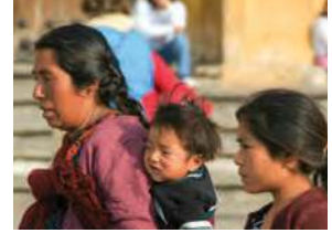
Figura 2.23 En México la población de indígenas tzotziles ha sido desplazada por el conflicto territorial entre los municipios de Chenalhó y Chalchihuitán, en Chiapas.

Apóyate en las lecciones 7 y 8 de tu libro de Formación Cívica y Ética para que analices las causas de los conflictos.