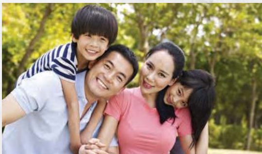
Figura 2.1 Familia de Corea del Sur.