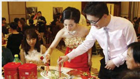
Figura 2.2 Boda tradicional china.