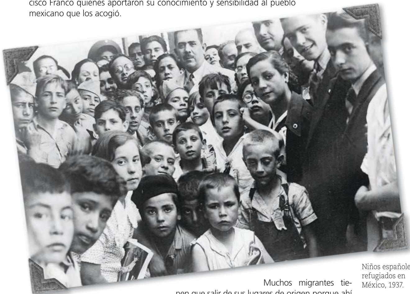
Niños españoles refugiados en México, 1937.

Pero siempre personas y grupos que migran, que vienen y van, llevan consigo lo que ha sido parte de su cultura de origen y toman parte de la cultura de los lugares por los que pasan o a los que llegan por un tiempo indefinido. Por ejemplo, en 1937 México recibió cerca de 25 mil españoles, niños, jóvenes y adultos, perseguidos por la dictadura de Francisco Franco quienes aportaron su conocimiento y sensibilidad al pueblo mexicano que los acogió.