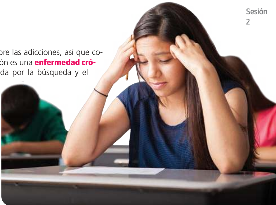
Figura 3.33 Las adicciones pueden afectar tu día a día.

Aunque la decisión inicial de consumir drogas sea voluntaria, una vez establecida la adicción, se vuelve una necesidad. Según la regularidad con que se ingrese la sustancia al cuerpo, el consumo de ella se clasifica en: