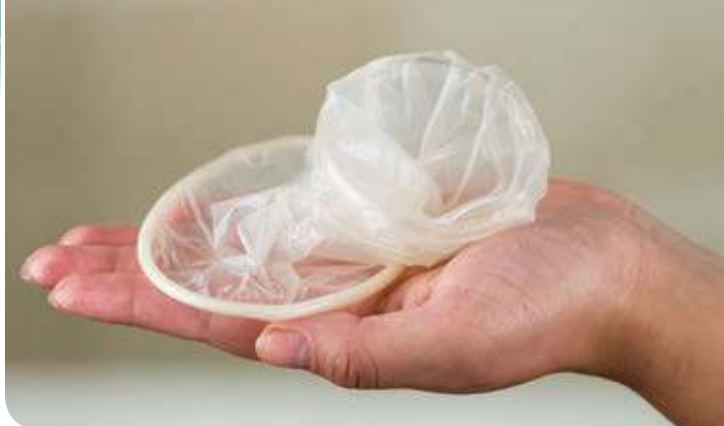
Figura 3.25 Los condones femeninos y masculinos son una opción efectiva para evitar embarazos no planeados.