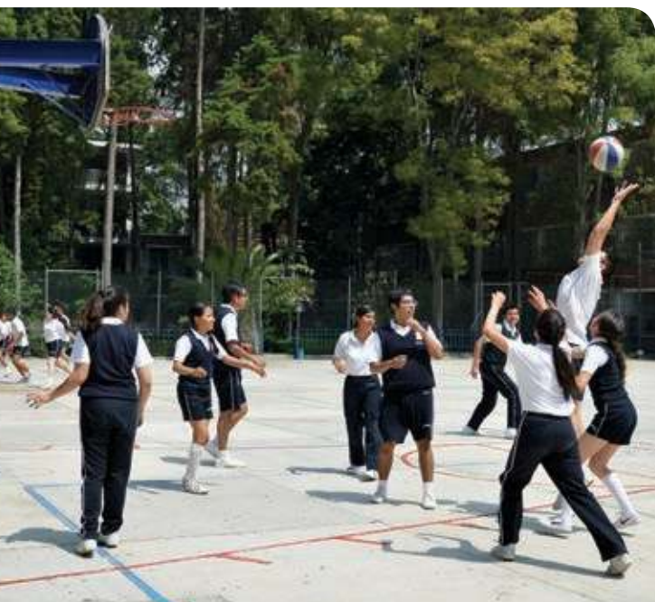
Figura 3.10 Durante la adolescencia puedes disfrutar tu crecimiento personal, a tu familia y estrechar lazos con tus amigos.