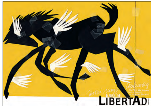
Lenguaje figurado (con comparaciones y metáforas)