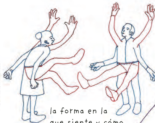
la forma en la que siente y cómo expresa sus emociones.