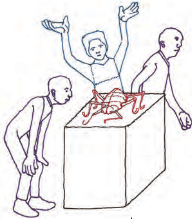
su manera de comportarse y la forma de reaccionar.