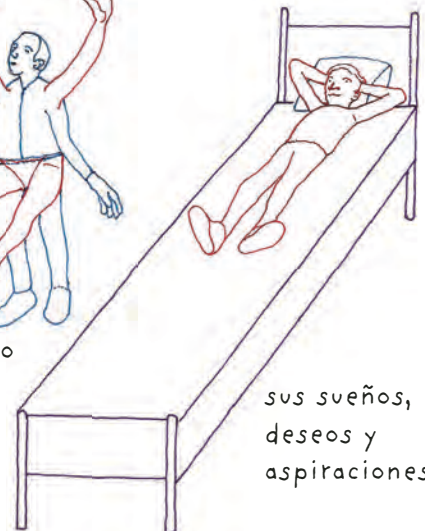
sus sueños, deseos y aspiraciones.

Un círculo de diálogo nos permite valorar a cada integrante, pues cada uno es un eslabón esencial de la comunidad, por eso dentro de un círculo debemos tratar a los otros como nos gustaría que nos trataran ●