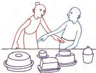
sus gustos, intereses y sus necesidades.