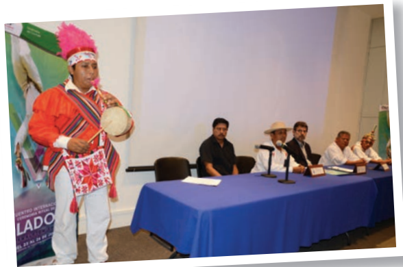
Hay diversas formas de conocer la perspectiva de quienes gobiernan sobre las necesidades y los intereses de la población.

Con el apoyo del recurso audiovisual Soberanía popular y representatividad comprenderás la relevancia de la participación ciudadana para lograr que los gobernantes se desempeñen con apego a la legalidad y trabajen en beneficio de la sociedad.