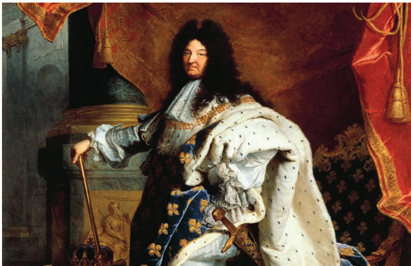
El rey Luis XIV es un representante de la concentración del poder político en Francia durante el siglo XVII y principios del XVIII.

Con la organización del gobierno en tres poderes se busca la distribución del poder político. Sus funciones se distribuyen en tres poderes: el Legislativo, el Ejecutivo y el Judicial. Cada uno requiere actuar con autonomía y debe haber un equilibrio entre ellos, como podrás ver en los esquemas de la siguiente página.