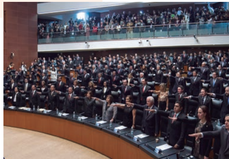
Los servidores públicos rinden protesta, es decir, asumen el compromiso de anteponer siempre los intereses de la ciudadanía.

Las actividades desarrolladas por las autoridades que forman parte de los órganos de gobierno consisten en un servicio a la población del territorio donde realizan sus funciones. Por esta razón se les llama servidores públicos, ellos encabezan labores que buscan el bienestar y la creación de las condiciones para el ejercicio de los derechos de la población.