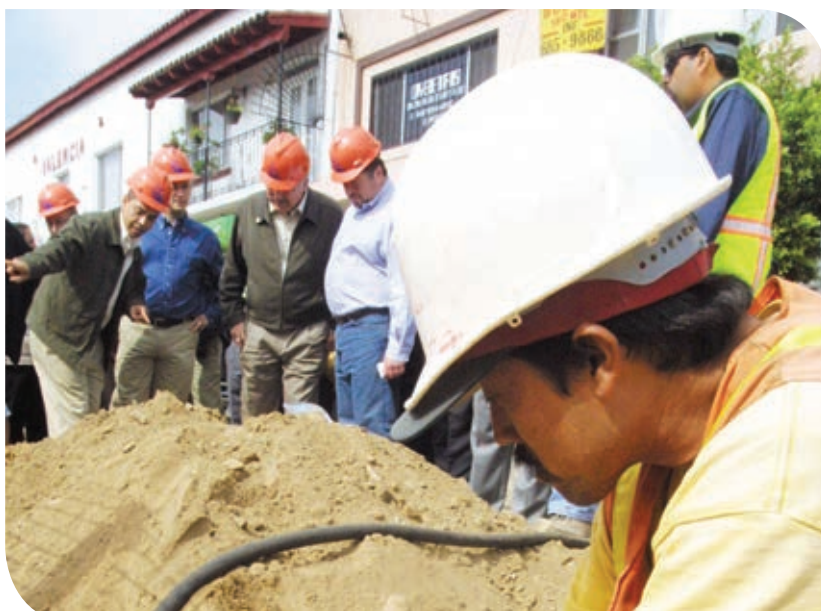
Las labores de los representantes populares siempre deben buscar el bienestar de la población.

Como puedes apreciar, las acciones que autoridades o funcionarios de gobierno realizan en un sistema democrático son diversas. Al llevarlas a cabo, adquieren responsabilidades relacionadas con el interés público, es decir, con los asuntos que son importantes para toda la población y que, en muchos casos, involucran las garantías que existen para ejercer los derechos.