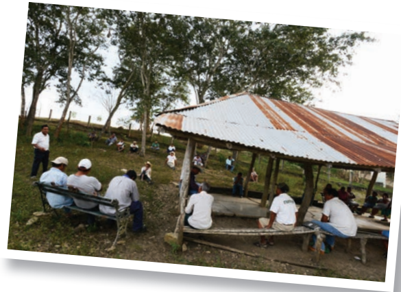
Los representantes son elegidos por los ciudadanos.

Uno de los emblemas de la Revolución Francesa fue la eliminación del poder político centrado en una sola persona. Durante varios siglos esa fue la norma: las decisiones de los gobernantes fueron determinadas por una persona —el rey o emperador—, así como el pequeño grupo que le rodeaba: consejeros, nobles, dirigentes de la Iglesia. El pueblo no tomaba parte y solamente era considerado por el valor de su trabajo en la producción de bienes y servicios, donde se les consideraba como esclavos, siervos o vasallos.