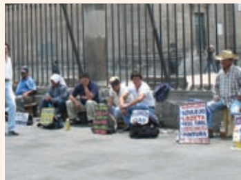
Falta de empleo

a) En pareja, observen las siguientes imágenes.