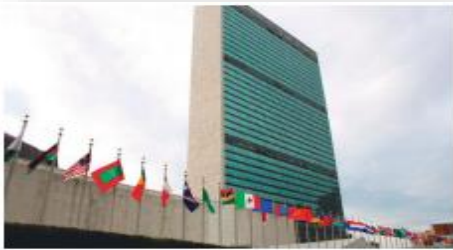
La ONU busca que los derechos humanos se apliquen en todo el planeta.

Los derechos aquí enunciados son algunos de los derechos humanos fundamentales. ¿Te imaginas un mundo en el que los derechos a la vida, a la propiedad y a la libertad sean atacados y anulados? En un ejercicio de imaginación seguro llegarás a la conclusión de que un mundo así sería injusto, ya que prevalecería la ley del más fuerte y por lo tanto, habría conflictos y peleas constantes, caos por doquier y, con toda seguridad, la destrucción de la sociedad.