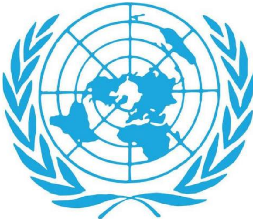
Logotipo de la ONU

Gracias a estas declaraciones se ha fortalecido paulatinamente la percepción y aceptación de que todos los seres humanos son personas con dignidad, y ésta es la principal razón de su existencia.