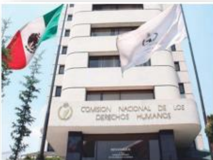
La CNDH busca defender los derechos de todos sin importar su condición.

Ante el derecho de que tu vida sea respetada, está el deber de cuidar de ella en cualquiera de sus expresiones, por ejemplo, cuidando tu salud, evitando el maltrato o descuido personal. Esto incluye alejarse de las conductas de alto riesgo que ponen en peligro tu salud, como algunas que actualmente se observan en los jóvenes e incluyen autoagresiones físicas y mentales, consumo de sustancias tóxicas, malos hábitos de alimentación, entre otras. Dichas prácticas van deteriorando al individuo y también son formas de atentar contra el derecho a la vida. Por otro lado, también se atenta contra este derecho en función de los demás en situaciones como el bullying, el cual daña física, verbal o emocionalmente a otra persona.