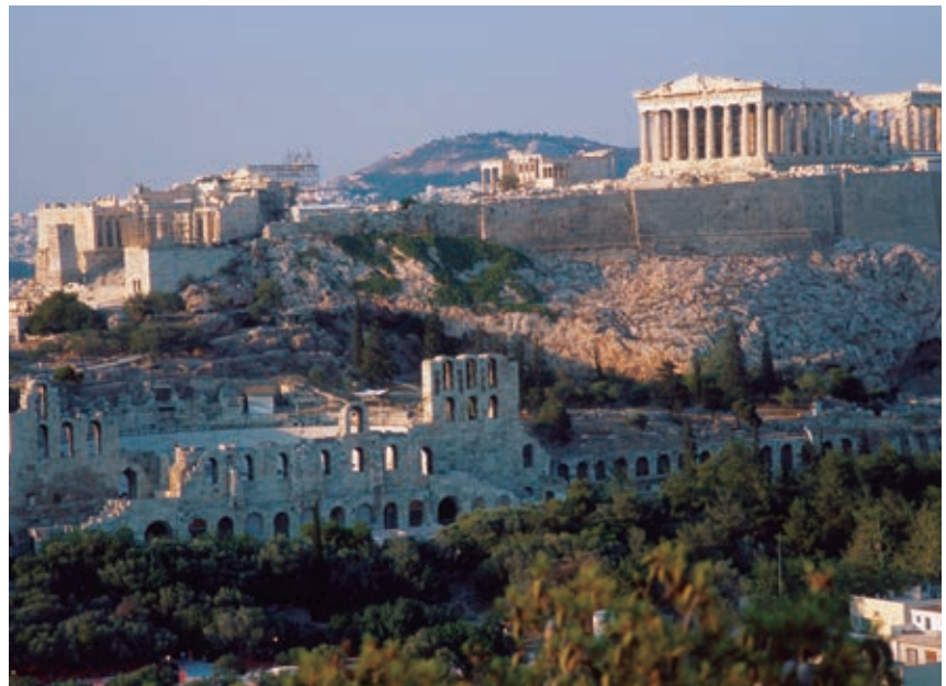
La acrópolis (que significa “cima de la ciudad”) se construía sobre una colina y estaba fortificada para poder defenderla fácilmente.

Los Juegos Olímpicos eran eventos deportivos y religiosos que se celebraban en la ciudad de Olimpia en honor a los dioses. Los participantes eran solamente hombres y las competencias consistían en carreras a pie, lucha, lanzamiento de disco y jabalina, salto de longitud y carreras de carros. Se consideraban tan importantes que, si las polis griegas estaban en guerra, establecían treguas durante su realización.