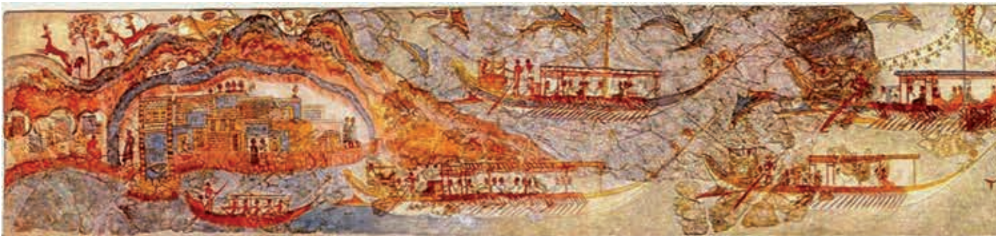
La navegación en el mar Mediterráneo. Pintura minoica.

Antes de que los primeros griegos llegaran a esta zona, en Creta ya había existido la cultura minoica. El pueblo cretense estaba constituido por navegantes que entraron en contacto con Egipto y Medio Oriente; su ciudad capital era Cnosos, que alcanzó un desarrollo notable. Se cree que desapareció por terremotos o por la violenta erupción de un volcán en una isla cercana.