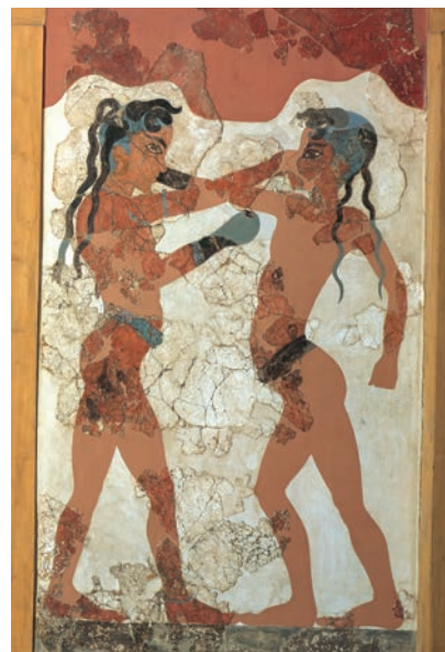
Escena de un combate. Imagen procedente de un cántaro (Atenas).

Entra al portal Primaria TIC: < http://basica.primariatic.sep.gob.mx >. En la pestaña Busca, escribe Esparta o Atenas .