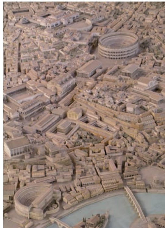
Ciudad de Roma.

Plebeyo. En la antigua Roma, persona perteneciente a la clase social que carecía de los privilegios de los patricios.