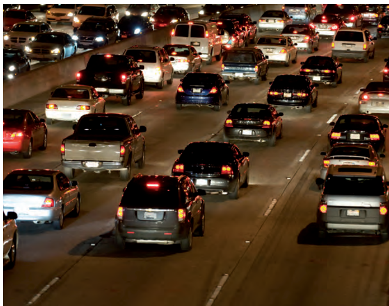
◆ Tráfico en la carretera.

Obtén tus conclusiones y compártelas con tu grupo.