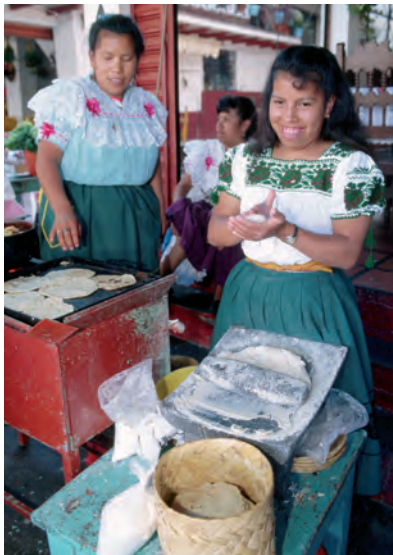
◆ El alimento que más se consume en México es la tortilla.

Anota tus conclusiones en el cuaderno y compártelas con el grupo.