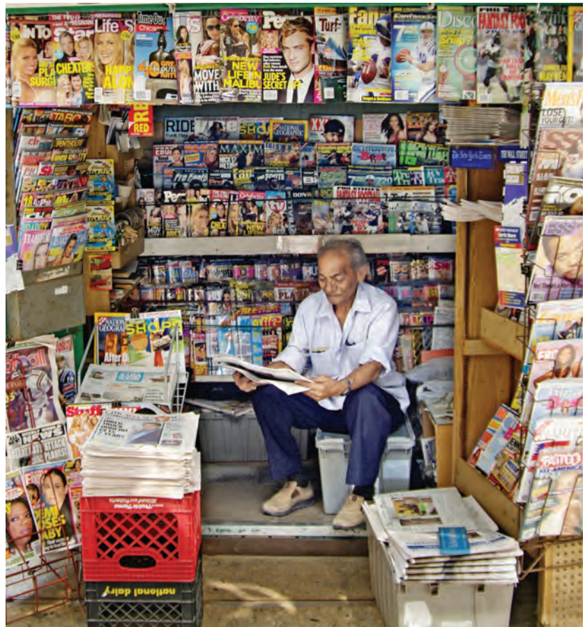
◆ A través de los medios impresos llegan hasta nosotros los anuncios publicitarios de diversos productos que influyen en nuestra decisión para adquirirlos o comprarlos.