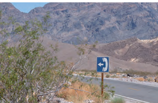
◆ En la zona rural también existe el servicio de telefonía, aunque es escaso.