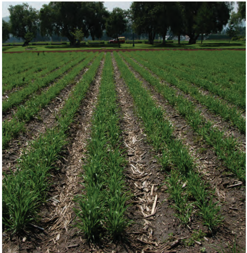
◆ Sembradío de caña en México. El paisaje agrícola es típico del espacio rural, es donde se producen los alimentos básicos de la población.