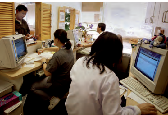
◆ Las oficinas proporcionan servicios como la realización de pagos, planeación de proyectos y actividades administrativas, por lo que su desarrollo es mayor en las ciudades.

Del mismo modo, tanto en las zonas rurales como en las ciudades se utiliza el teléfono, pero por la concentración de personas en las ciudades es necesario un mayor número de aparatos telefónicos, pues se realizan más llamadas; por lo tanto, se emplean más kilómetros de cableado, más postes y hay más encargados de repararlos y mantenerlos en funcionamiento. Como en las ciudades la densidad de población es mayor, el suministro de productos y servicios para cubrir las necesidades también es más grande.