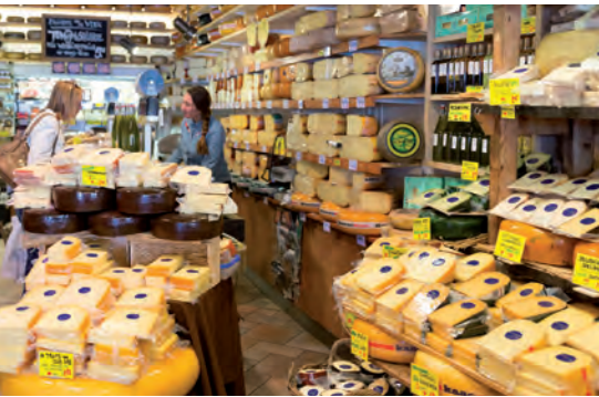
◆ Tienda de quesos en Ámsterdam, Holanda

El video que encontrarás al escanear el código QR o entrar en la siguiente liga: https://bit.ly/2XGU1pU te ayudará a distinguir las principales diferencias poblacionales, sociales y económicas entre los espacios urbanos y los espacios rurales.