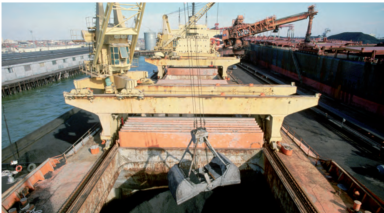
◆ Desembarcando carbón en un puerto en Virginia, Estados Unidos.

Finalmente, los recursos energéticos son aquellas sustancias usadas para producir energía, como el petróleo, el gas, las corrientes de agua y la radiación solar. Esta energía es utilizada como combustible para mover automóviles, aviones o para transformar las materias primas en productos de consumo.