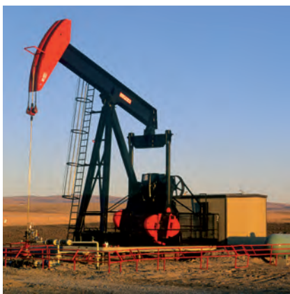
◆ Pozo petrolero en Canadá.

El suelo es otro recurso natural aprovechado por la gente para su sustento. Existen suelos con composición y grosor diferentes, por lo que de acuerdo con sus características se convierten en sustento de diferentes tipos de vegetación que predomina en las selvas, bosques o matorrales. De todos ellos, los suelos más apreciados por el individuo son los que contienen abundante materia orgánica, pues se utilizan en la agricultura; entre éstos destacan las llanuras centrales de Norteamérica, las llanuras rusas y las de Europa central.