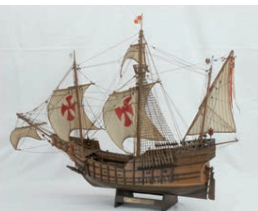
Maqueta que representa una de las embarcaciones de Cristóbal Colón.

Cuando regresó a España, Colón llevó a varios nativos esclavizados, pequeñas cantidades de oro y muestras de flora y fauna desconocidas