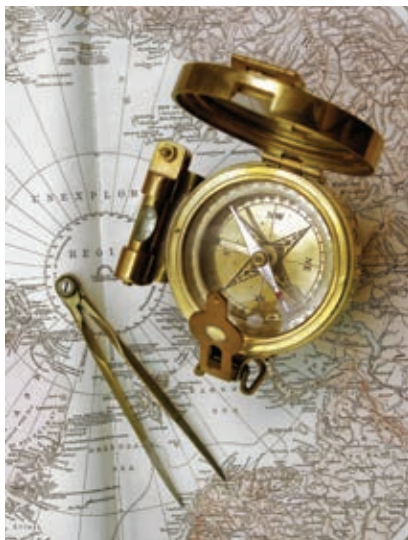
Brújula y compás, instrumentos empleados para navegar en altamar.

la primera por toda la costa del continente africano hasta rodearlo por el sur; y la segunda, hacia el oeste, cruzando el océano Atlántico. También se consideró la posibilidad de llegar a Oriente por el norte, cruzando los hielos del océano Ártico, pero fue descartada.