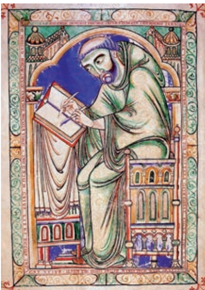
Retrato de un monje copista de la época medieval.

Copista. Persona que se dedicaba a reproducir libros a mano.