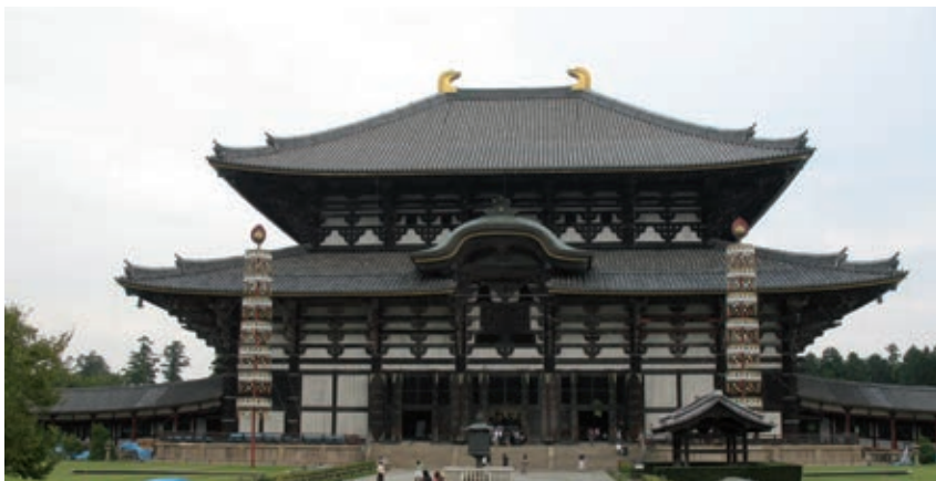
Templo budista Todai-ji en Nara, Japón. Es considerado el edificio de madera más grande del mundo; en él es posible reconocer la influencia china.