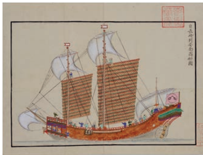
Los juncos, buques característicos del mar de la China, eran barcos muy estables que navegaban en aguas poco profundas.

La Gran Muralla fue construida a lo largo de 1 100 años a partir del siglo V a. C. para servir de protección ante los ataques de los guerreros nómadas. Se calcula que en su construcción participaron diez millones de trabajadores. Mide de seis a siete metros de alto y entre cuatro y cinco metros de ancho; llegó a tener una longitud de más de veinte mil kilómetros, pero hoy sólo se conservan 8 851 kilómetros. Dada su extensión, llegó a ser vigilada por cerca de un millón de soldados. Hoy es patrimonio de la humanidad.