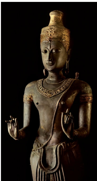
Estatua de bronce que representa al dios Shiva, uno de los principales en India.

Entre los aportes de la civilización india destacan la rueca para hilar algodón, el astrolabio, la utilización de metales en la