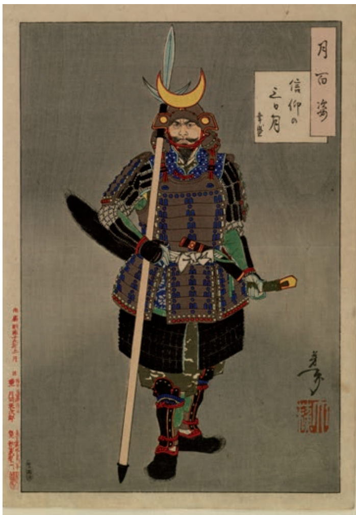
La armadura samurái japonesa estaba hecha con pequeñas placas de metal que la hacían ligera y flexible.

A finales del siglo XIII se generalizó el uso del dinero, que consistía en monedas provenientes de China que los japoneses intercambiaban por oro, perlas, azufre, madera, armas, entre otros productos. El comercio floreció debido a estos intercambios y se convirtió en una de las principales actividades económicas.