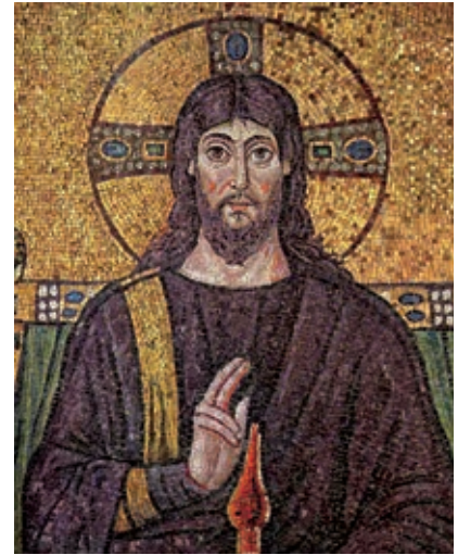
Pintura de Cristo en mosaico.

También a nuestra época han llegado obras artísticas del mundo antiguo, como esculturas, pinturas murales y objetos de la vida cotidiana que han tenido influencia en las culturas a lo largo de la historia.