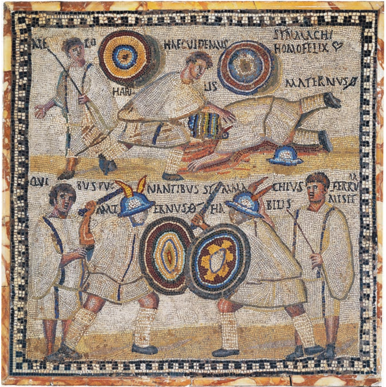
Representación de un combate entre gladiadores.