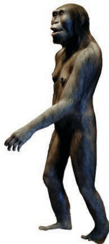
Representación de cómo se cree que podría haber sido Lucy , un Australopithecus afarensis . En su momento, fue conocido como el ancestro más antiguo del ser humano.