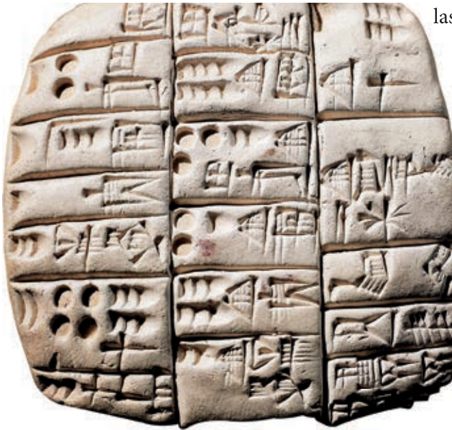
Escritura cuneiforme. Se le dio este nombre porque los signos tienen forma de cuña o triángulo.

A partir del proceso de sedentarización se desarrollaron las primeras aldeas que llegaron a tener algunos cientos de habitantes. Había campesinos, ganaderos, artesanos, comerciantes y personas con funciones religiosas y políticas. En las más pobladas se empezaron a construir centros ceremoniales y viviendas. Esta urbanización era rudimentaria, como Catal Huyuk (Turquía), en el milenio VII a. C., donde no había calles y se entraba a las viviendas por los techos de las habitaciones, construidas con adobe.