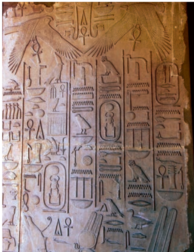
Escritura jeroglífica: compuesta por signos que representan ideas y sonidos.

La invención de la escritura marca el fin de la prehistoria, ya que, con ella, el ser humano pudo dejar registros escritos, que más tarde sirvieron como fuente para el estudio de la historia.