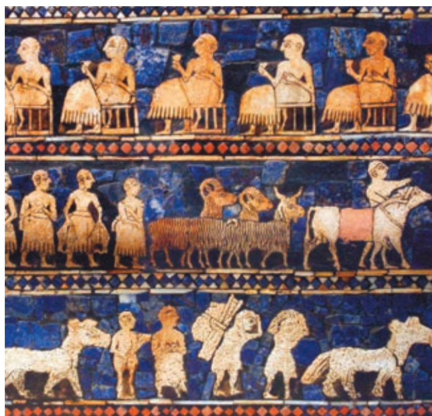
Representación del pastoreo en Ur, una de las más antiguas y pobladas ciudades de Mesopotamia, hoy Irak. La imagen es el detalle de un grabado.