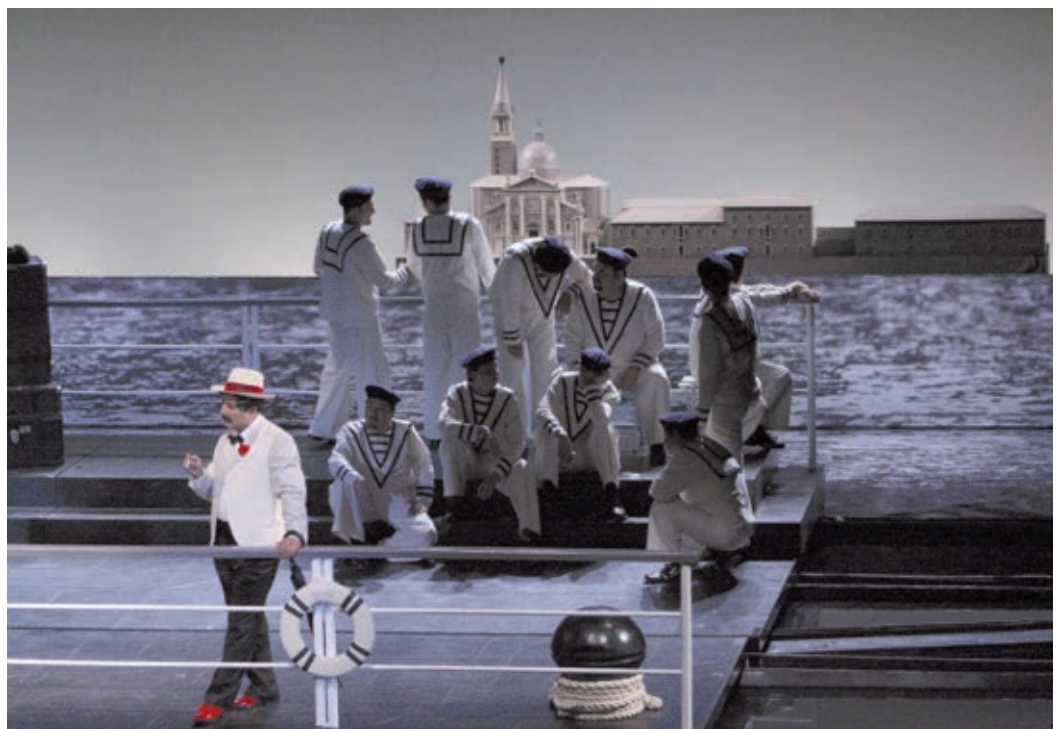
Muerte en Venecia, Compañía Nacional de Ópera de México.