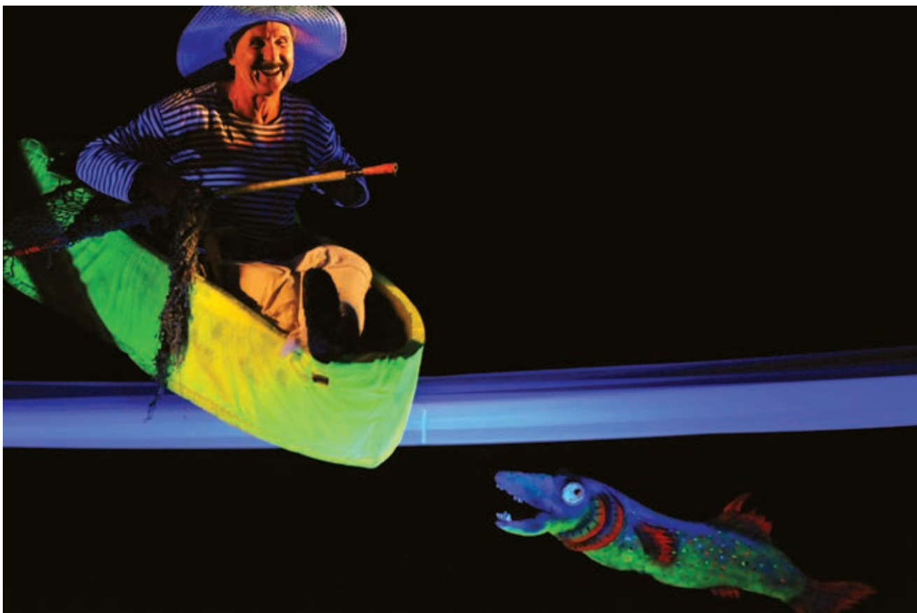
Las aventuras de Fausto, Teatro Jorge Isaacs, Cali, Colombia.

El teatro ha cambiado a lo largo del tiempo y seguramente seguirá cambiando al incorporar elementos derivados de las nuevas tecnologías.