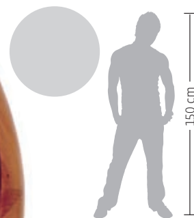
Frida Kahlo (1907-1954), Naturaleza muerta , 1942, óleo sobre lámina de cobre (63 cm de diámetro).