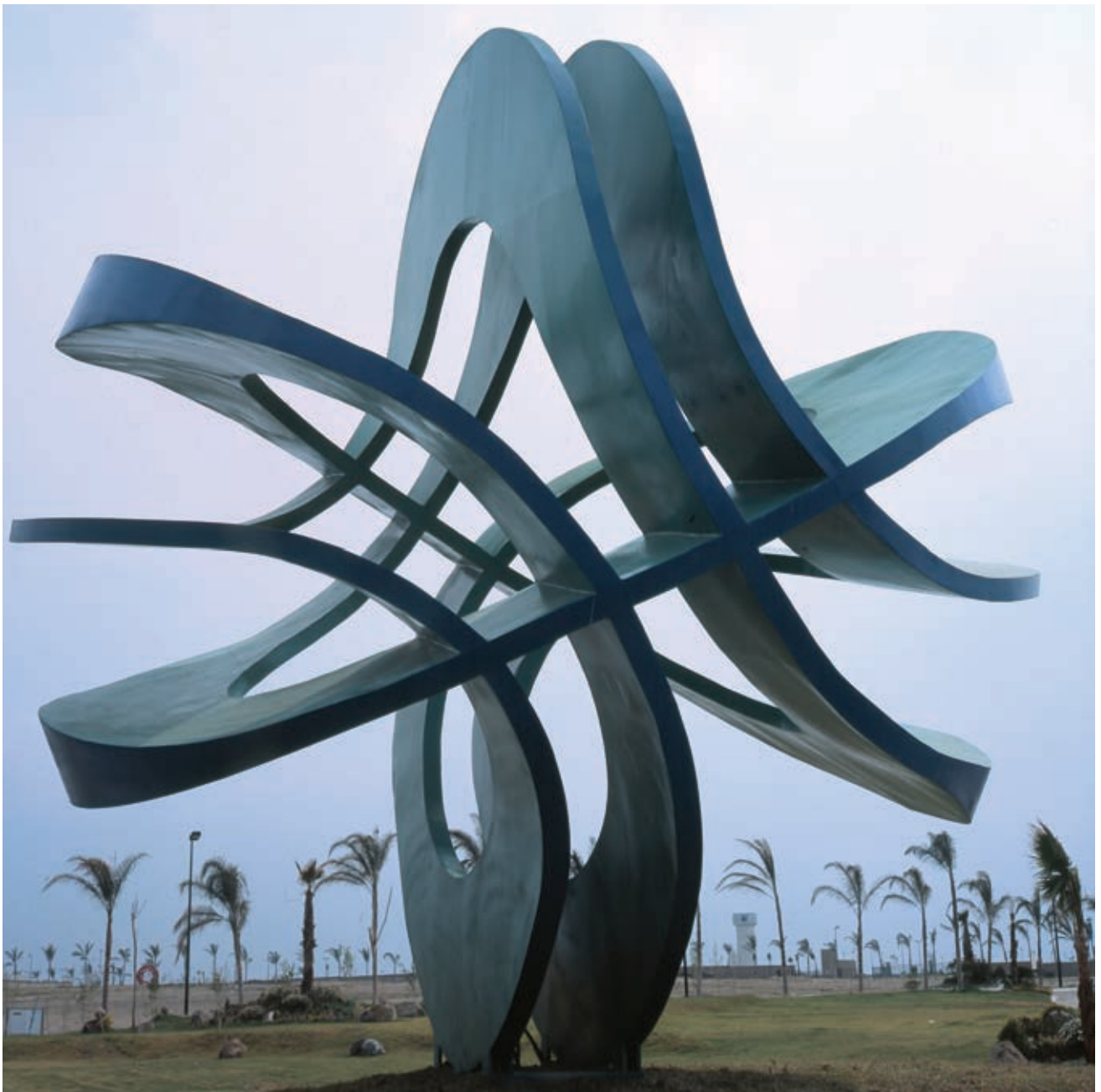
Yvonne Doméngue (1946- ), Circontinuo , 2004, escultura monumental, acero al carbón (6 m de diámetro).