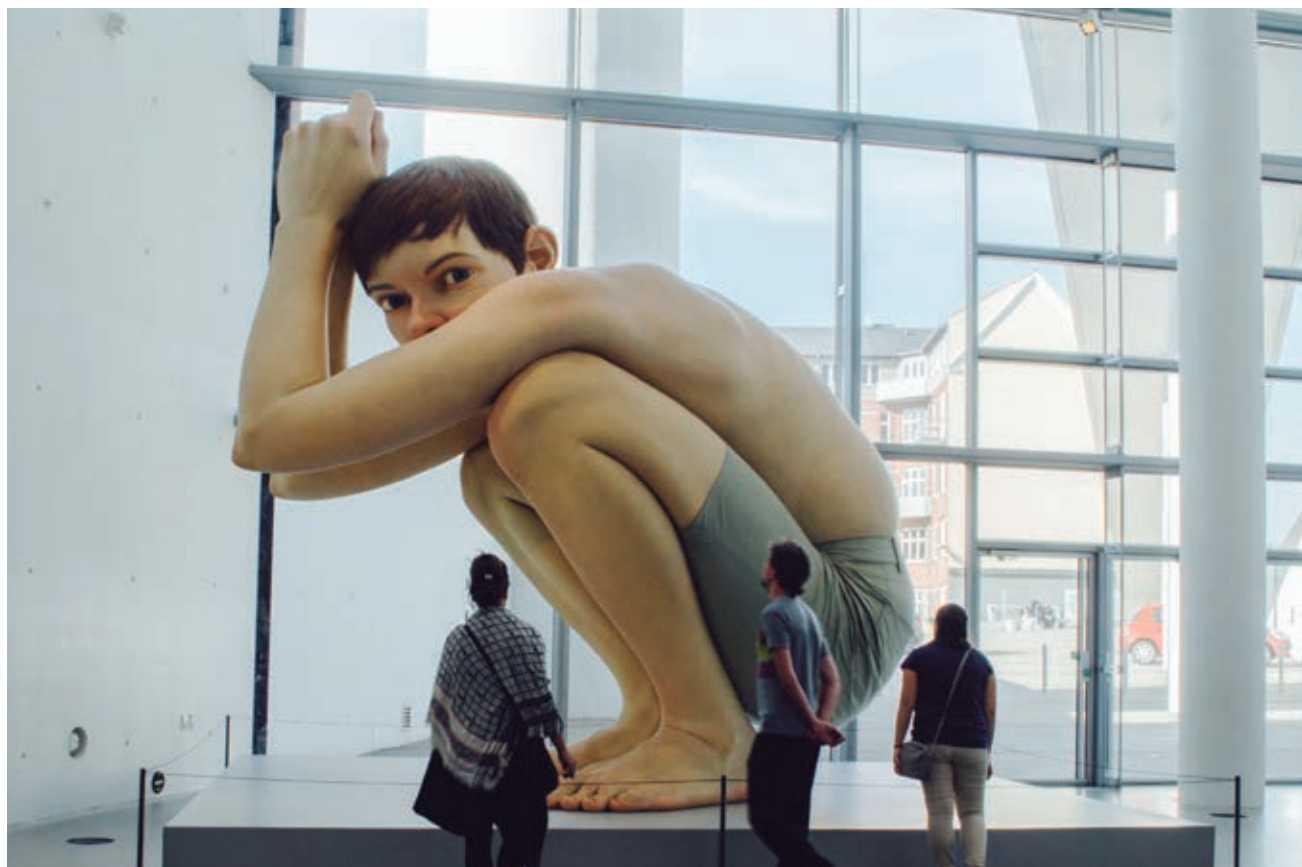
Ron Mueck (1958-) Muchacho , 1999, poliéster, resina y silicona (4.5 m de altura, 500 kg de peso), Museo Aarhus Kunstmuseum, Dinamarca.