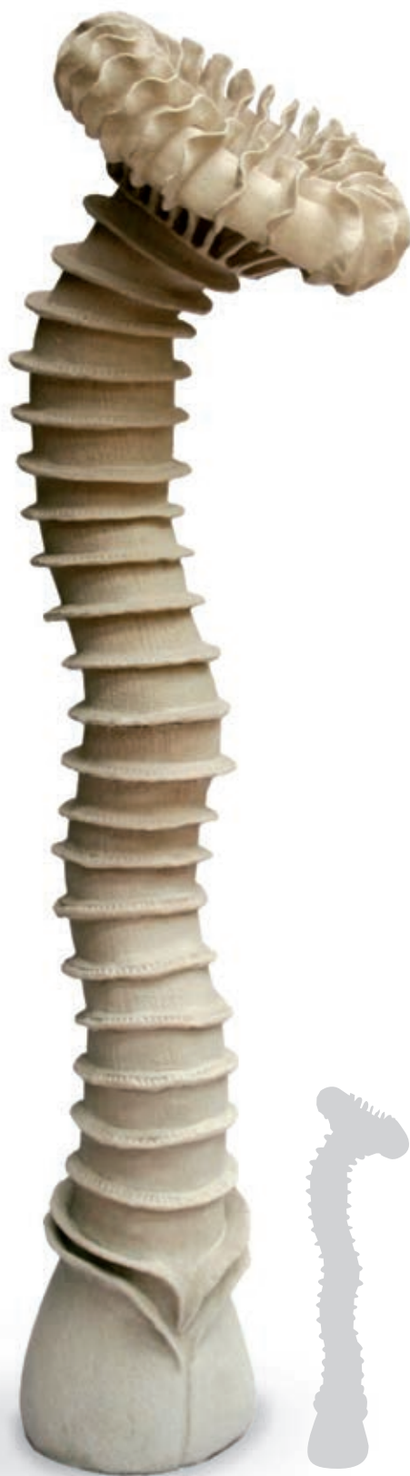
Maribel Portela (1960- ), Palmaeformis detractora , 2008, barro y engobe (170 × 47 × 47 cm).

Necesitarás música tradicional mexicana y un reproductor de sonido para el grupo. De ser posible, inviten a una persona que conozca algún baile folclórico de México.