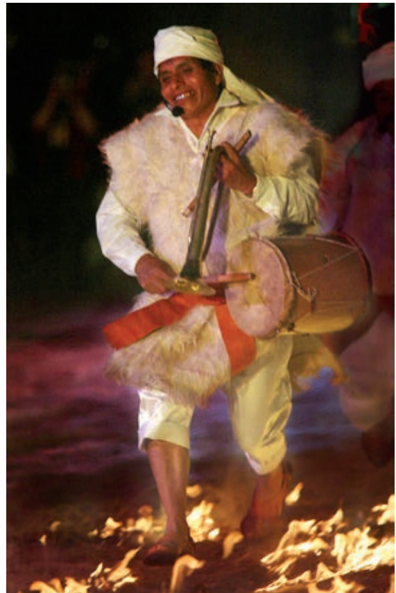
Danza de la purificación , capellanes de la comunidad de San Juan Chamula, Chiapas.