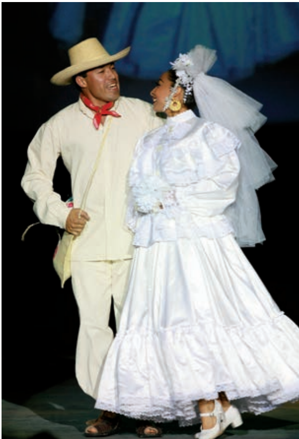
Acuarela potosina , Ballet Folclórico Potosino.

En esta lección crearán una composición dancística inspirada en la música tradicional mexicana que trajeron a clase. Si han visto bailes folclóricos con esa música o con otra, recuerden algunas de sus secuencias e intenten recrearlas durante su baile.