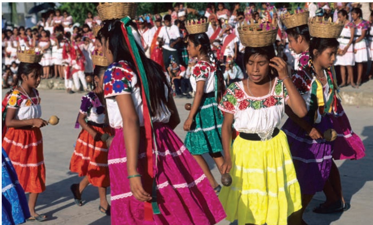
Danza huasteca nahua, Chiconamel, Veracruz.

Las diversas expresiones de los bailes folclóricos son, en general, interpretaciones de la cultura local; por eso pueden referirse al festejo de una boda, a momentos de la pesca o de la cosecha, o a otros aspectos de la vida cotidiana. En algunos estados de la República Mexicana también se incorporan a los bailes anécdotas o expresiones locales,