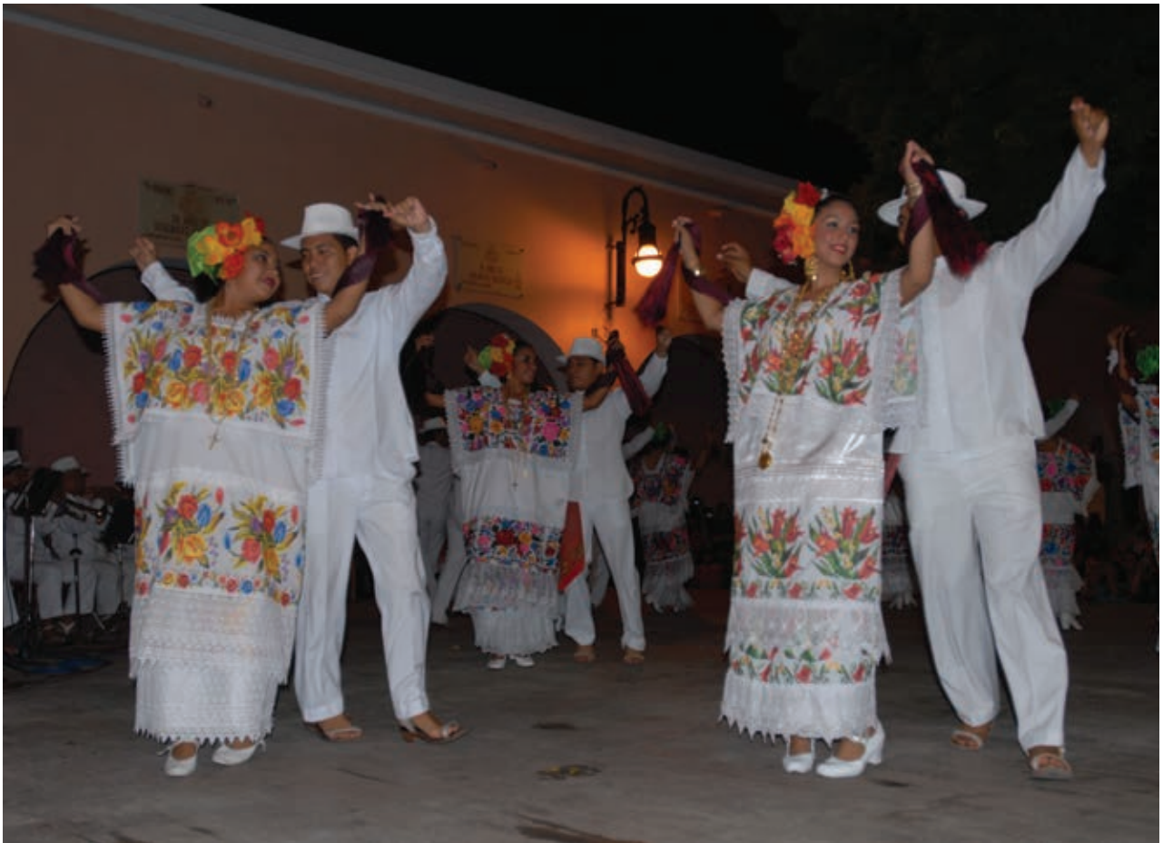
Jarana yucateca, Mérida, Yucatán.

Necesitarás instrumentos como maracas, panderos y algunos objetos del Baúl del arte que puedan servir como idiófonos, y la grabación de una canción. De ser posible, inviten a un músico a tocar en su salón.