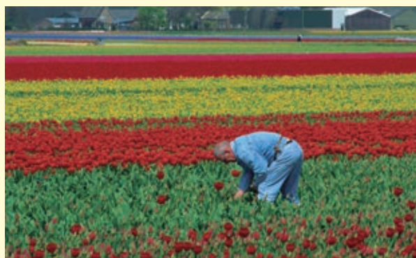
❖ Campesino en Holanda.