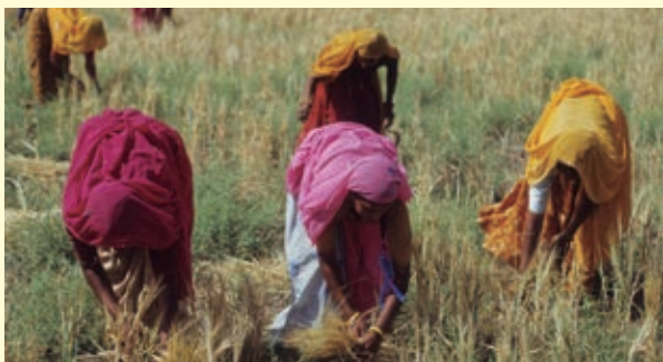
❖ Comunidad rural, India.

Anoten en su cuaderno qué creen que significa la expresión calidad de vida .