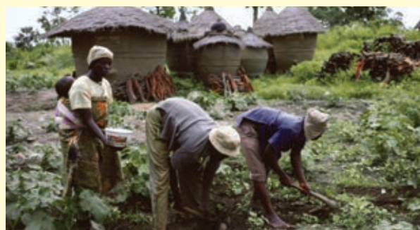
❖ Comunidad rural, Nigeria.