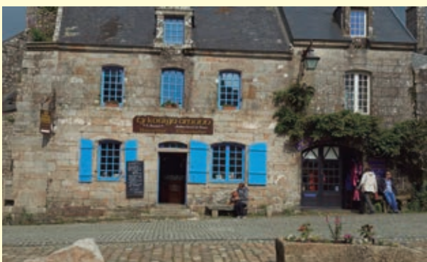
❖ Tienda rural, Francia.