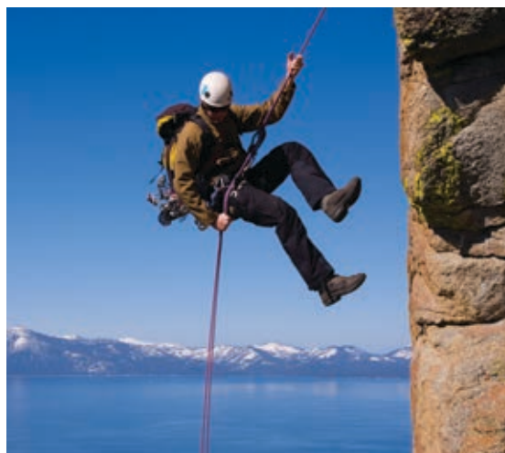
◆ El turismo como actividad deportiva es una fuente de ingresos importante en países montañosos como México.

Fuentes: < https://www.thenewbarcelonapost.com/es/los-20-museos-mas-visitados-del-mundo/ > y < https://elpais.com/cultura/2019/06/12/actualidad/1560333217_731122.html >.