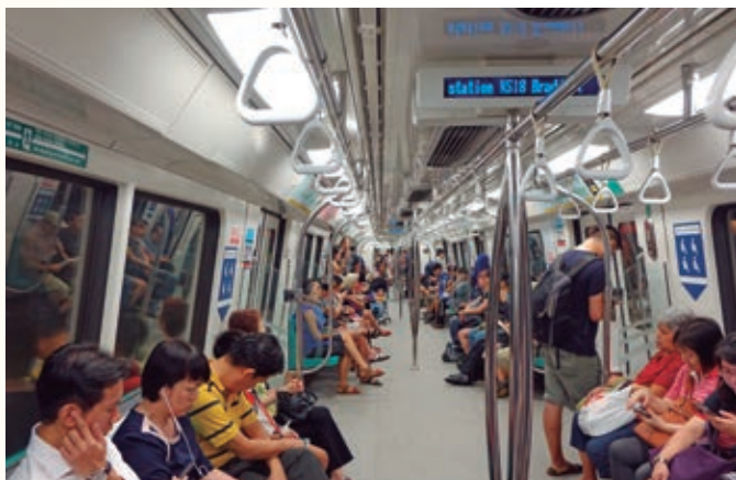
❖ Tren subterráneo, Singapur.