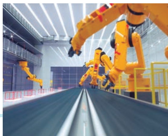
◆ Robot industrial en una fábrica de Oriente.