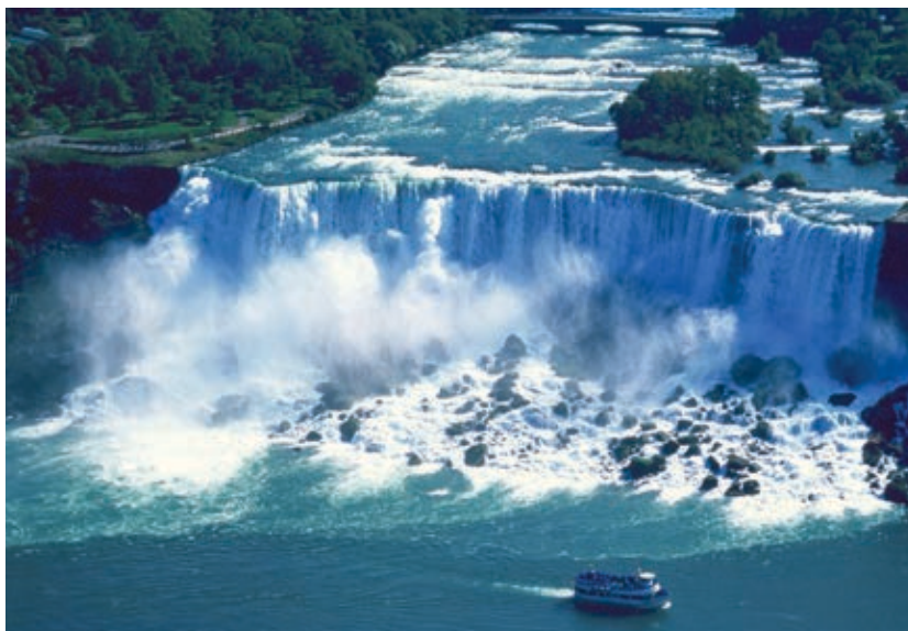
◆ Toma aérea de las cataratas del Niágara.