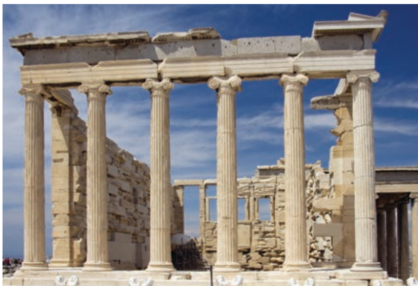
◆ Zona arqueológica, Atenas, Grecia.

El turismo es una de las actividades económicas del sector terciario que pueden traer beneficios a las naciones donde se realizan; por ejemplo, a México llegan cerca de 21 millones de turistas al año; después del petróleo y las remesas, el turismo es la tercera fuente de ingresos para nuestro país.