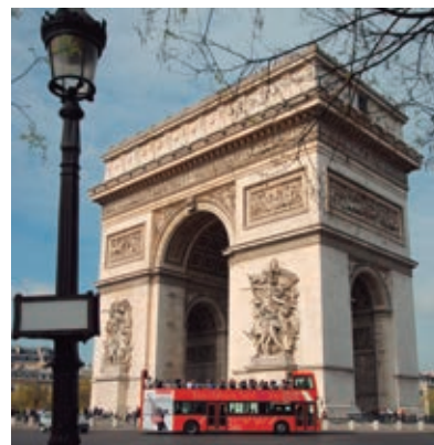
❖ Autobús de dos pisos, París.