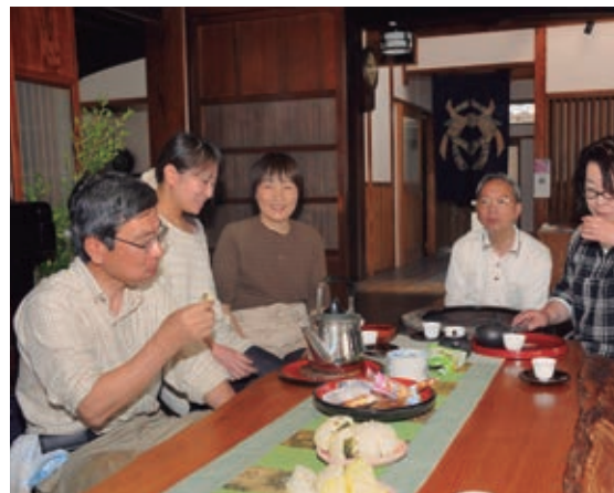
◆ Familia oriental comiendo pescado.

Los países venden los recursos que tienen en abundancia o lo que han aprendido a producir y compran aquello que no tienen, o bien, que no producen. Eso define los principales productos del comercio internacional.