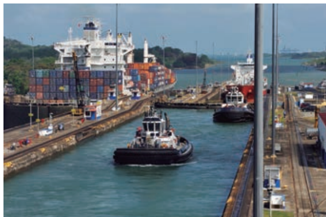
❖ Canal de Panamá.