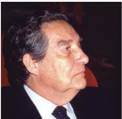
Octavio Paz, escritor (1914-1998). Premio Nobel de Literatura 1990.