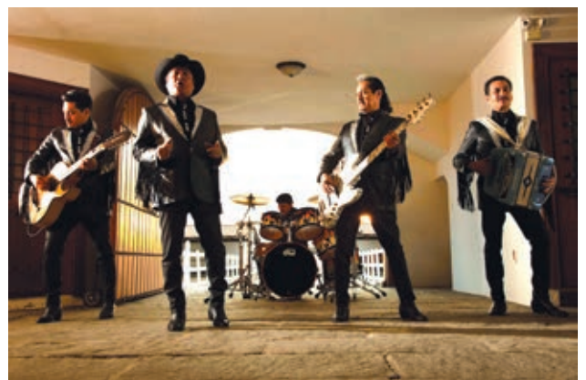
Los Tigres del Norte.