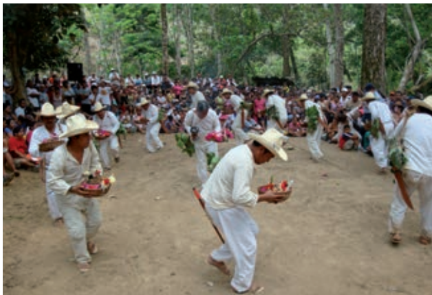
Festividad indígena zoque.