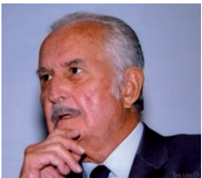
Carlos Fuentes Macías, escritor (1928-2012).

Expresiones culturales. Son las diferentes maneras y medios con los que las personas, pueblos y grupos sociales manifiestan su particular modo de vida y sus ideas.