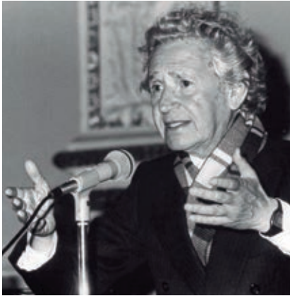
Juan José Arreola, escritor (1918-2001).