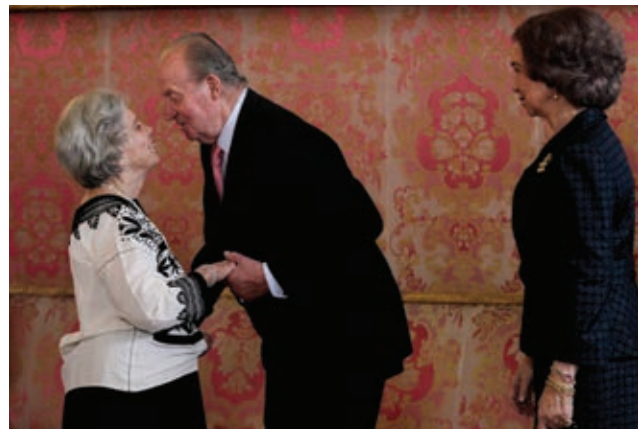
Elena Poniatowska, escritora y periodista reconocida con el Premio Cervantes 2014.