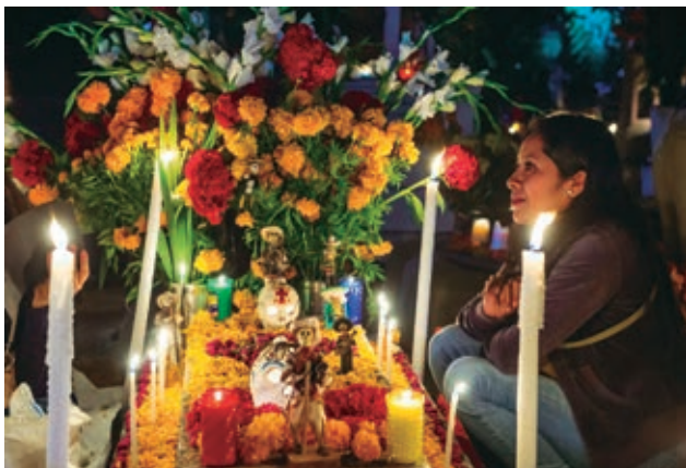
Celebración del Día de Muertos.