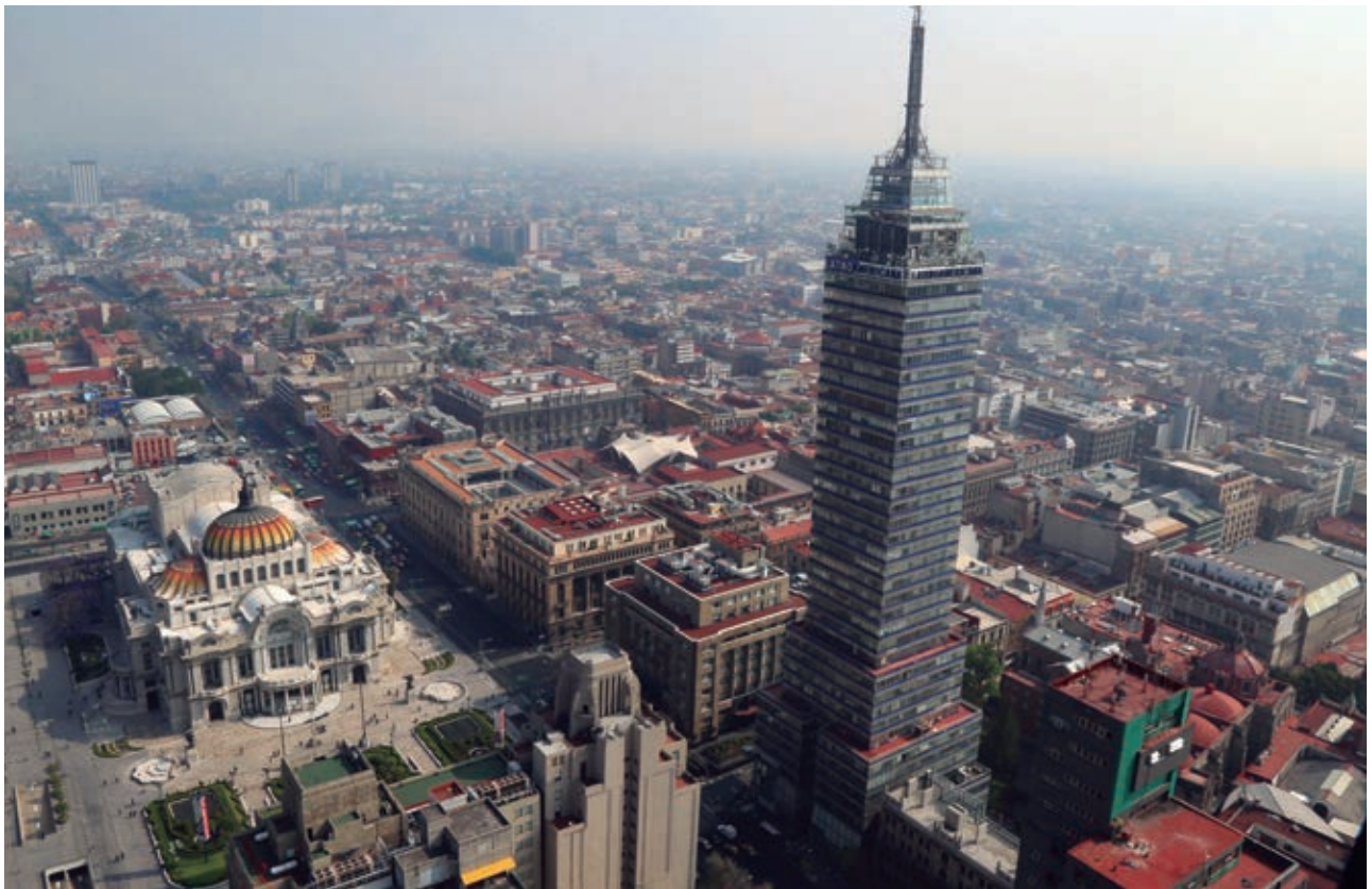
Vista panorámica del Palacio de Bellas Artes y la Torre Latinoamericana.

En este periodo, la población mexicana aumentó casi el doble, al pasar de 66.8 millones de habitantes en 1980 a 112.3 millones en 2010. Actualmente, la mayor parte de los habitantes del país son jóvenes y viven en centros urbanos.