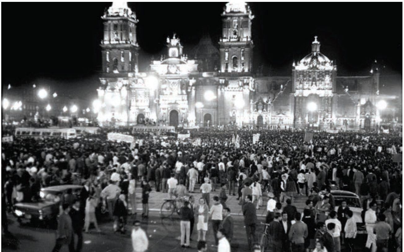
Manifestación estudiantil en el Zócalo de la Ciudad de México.

Así se consideraba al hecho de difundir, de forma hablada o escrita, a través de cualquier medio, propaganda política con ideas que perturbaran el orden público o afectaran la soberanía del país.