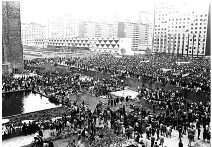
2 de octubre de 1968, Plaza de las Tres Culturas, Tlatelolco, Ciudad de México.

Indaga por qué protestaban los estudiantes y sobre algunos acontecimientos importantes del movimiento y lo ocurrido el 2 de octubre de 1968. Anota la información que investigues y, junto con la que lleven tus compañeros, hagan un periódico mural. Péguenlo en un lugar visible de la escuela para que todos sepan qué pasó en México en ese año. No olviden hablar de la importancia de este acontecimiento en nuestra vida actual.