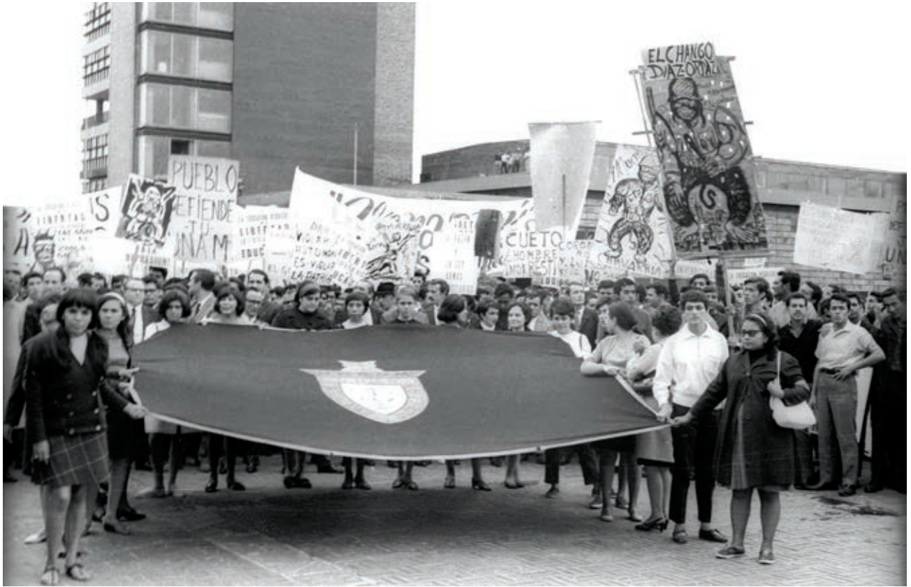
Manifestación estudiantil frente al edificio de la rectoría de la UNAM, en 1968.