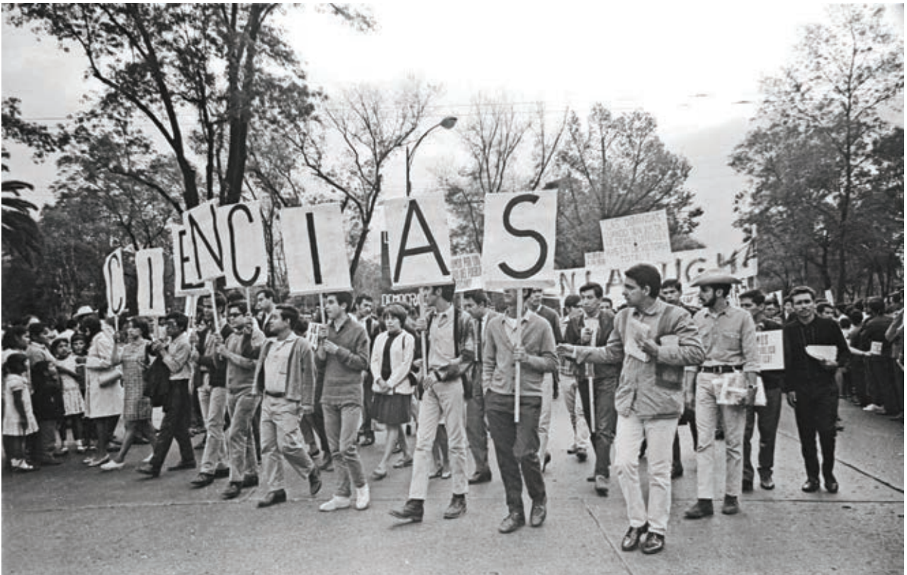
Marcha del silencio en 1968.

Pero ¿qué consecuencias tuvo el movimiento estudiantil de 1968? Después de los acontecimientos de Tlatelolco, diversos sectores de la población se unieron para protestar en contra de la represión policiaca y del ejército. Además, los cuestionamientos y críticas hacia el partido oficial (PRI) fueron más constantes y se hicieron desde diferentes expresiones culturales. Entre otras, en la música, Álex Lora y Óscar Chávez; en la literatura, Carlos Monsiváis y Elena Poniatowska; en la poesía, Octavio Paz. Asimismo, se considera que después del 2 de octubre se inició un proceso de desgaste de la legitimidad del gobierno del PRI. Otros movimientos posteriores (guerrillas, sindicatos, partidos de oposición, etcétera) contribuyeron con sus luchas a la democratización del país y a la alternancia en el gobierno, como veremos en el siguiente bloque.