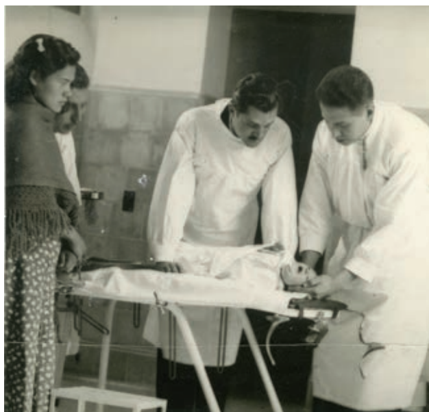
Médicos atendiendo a un paciente.