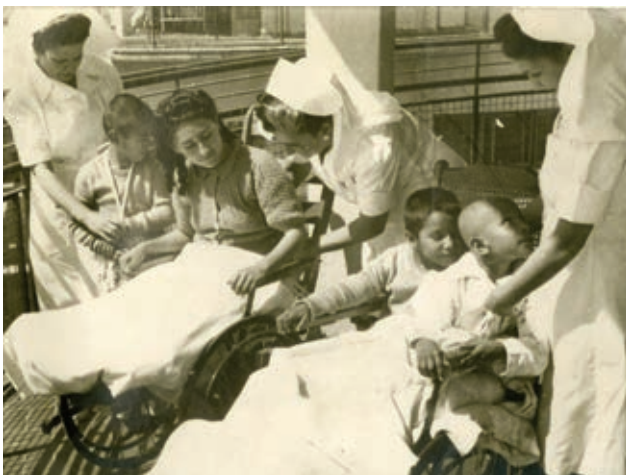
Niños en el Hospital Infantil.