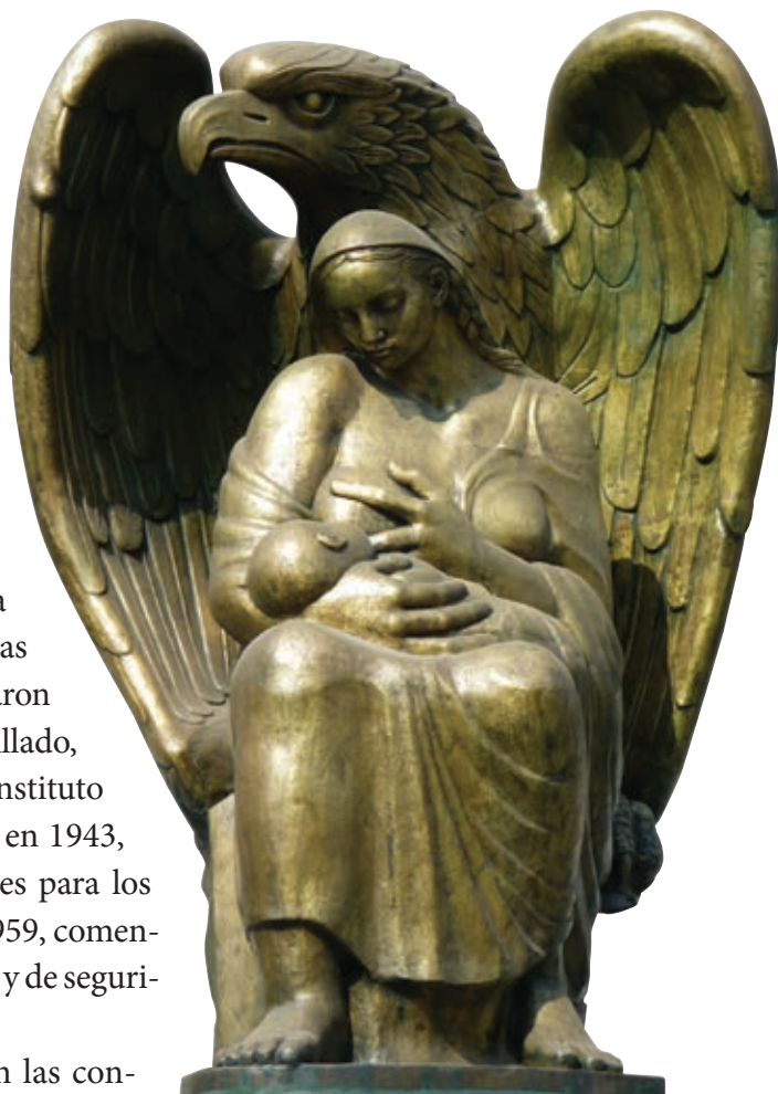
Maternidad IMSS, ca. 1960, Federico Cantú.

Las cifras del crecimiento de la población durante este periodo pueden ayudar a comprender mejor su magnitud. En 1920 habitaban el país 14 millones de personas, en 1940 había 20 millones, y para el año 1970, la cifra era de 48.2 millones. Gran parte de los problemas que se generaron en el México contemporáneo fueron resultado de este acelerado crecimiento de la población, pues el dinero nunca fue suficiente para dotar de servicios básicos a todos los habitantes del país.