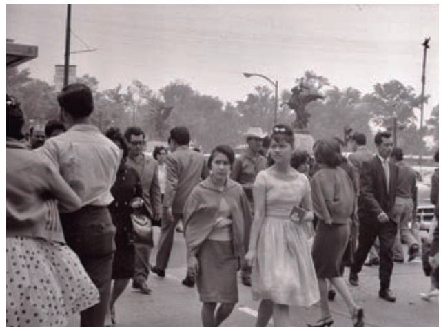
Nueva gente, nuevas modas.