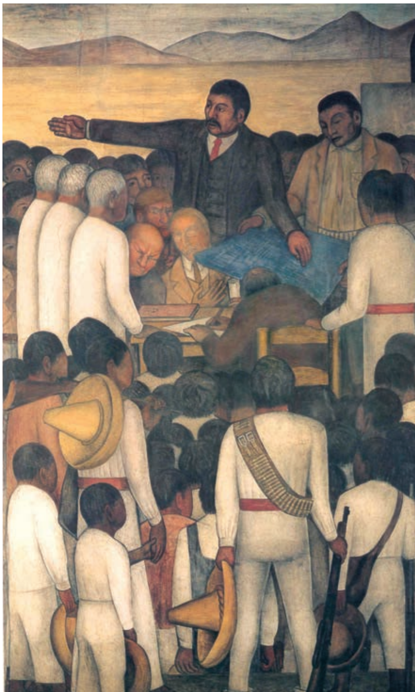
Detalle del mural Dotación de ejidos , 1923-1924, Diego Rivera.

Después de 1940 el gobierno había disminuido el reparto agrario, al mismo tiempo, retrasó y condicionó los créditos a lealtades políticas. Además, los grandes propietarios aumentaron su número. Hubo veces en que los campesinos invadían tierras y reclamaban al gobierno su restitución. Así, por ejemplo, en la década de 1940, Rubén Jaramillo organizó al campesinado de Morelos para reclamar la continuidad de los repartos y el respeto a los ejidos existentes. No obstante, cada vez fueron más los campesinos sin tierra y sin empleo; muchos de ellos emigraban, solos o con sus familias, a las grandes ciudades o a Estados Unidos en busca de empleo y mejores condiciones de vida. Esto provocó, en la década de los setenta, los asentamientos irregulares y la demanda de servicios públicos como el agua potable, la luz y el drenaje.