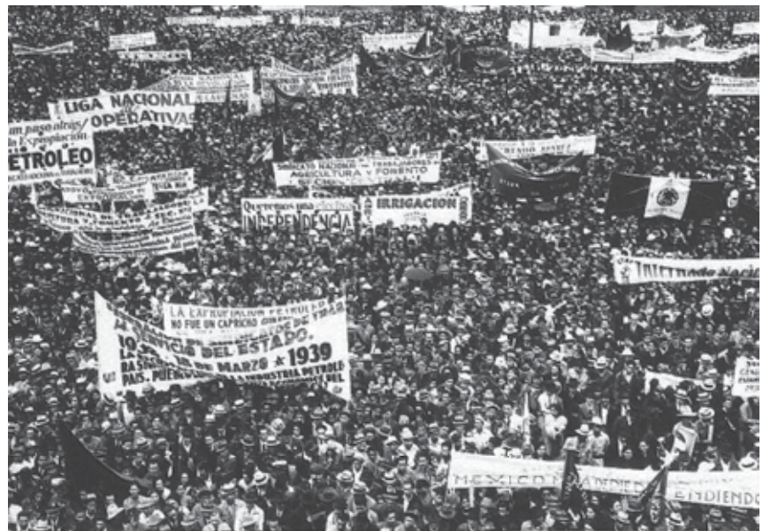
Manifestación obrera, Ciudad de México, 1939.

Amnistía. Consiste en anular la culpabilidad legal de una persona o de un grupo.