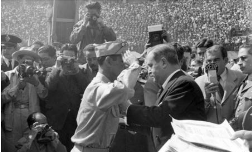
El presidente Manuel Ávila Camacho condecora a un miembro del Escuadrón 201.

exportación de materias primas para la industria bélica de Estados Unidos y con trabajadores agrícolas empleados en las industrias y campos de ese país; segundo, México participó con el envío de elementos de la fuerza aérea, el Escuadrón 201, para combatir a los japoneses posicionados en Filipinas y Formosa, Taiwán, en 1945.