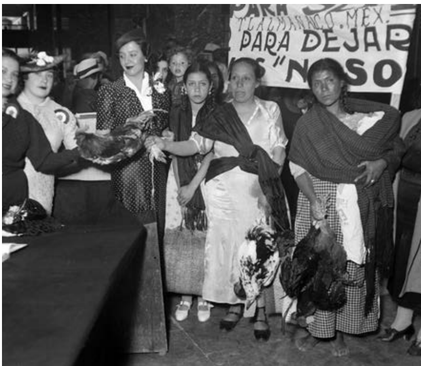
Lo mismo joyas que gallos y gallinas sirvieron para contribuir al pago de la deuda petrolera. Aquí uno de los comités femeninos en la entrega de donativos.