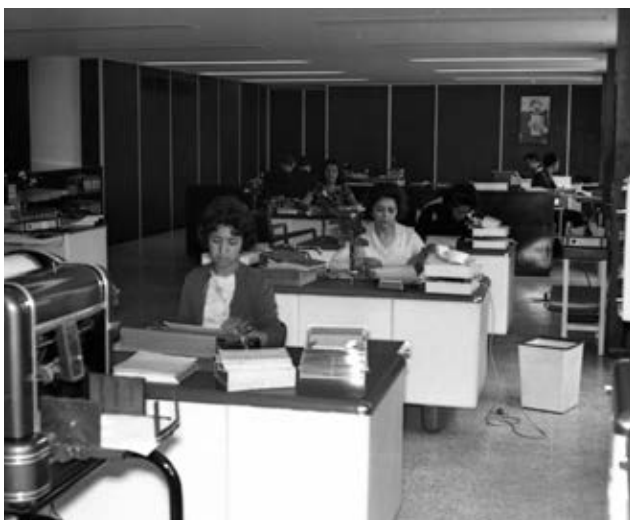
Mujeres laborando en la Comisión Nacional de Libros de Texto Gratuitos, década de 1960.

En la década de 1960 aumentó la inconformidad ante la falta de libertades políticas y la desatención del gobierno a las demandas de la población trabajadora. Durante la presidencia de Adolfo López Mateos (1958-1964), por ejemplo, ocurrieron 2 358 huelgas. Entre 1964 y 1965 varios centros hospitalarios en el país se vieron afectados por el paro de médicos residentes del Hospital 20 de Noviembre. A mediados de la década de 1960 se inició un periodo de actividad de varios grupos armados que fueron orillados a buscar transformar al país por medio de la violencia. Algunos de ellos operaban en las ciudades y otros, como los