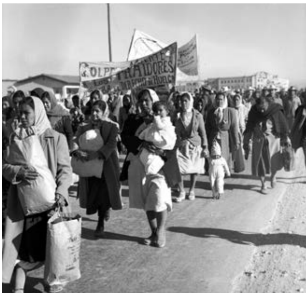
Mujeres con mantas y pancartas en apoyo a la marcha "Caravana del Hambre", 1951.

La población trabajadora del país participó en la Revolución con la esperanza de fundar un nuevo gobierno que mejorara sus condiciones de trabajo y su calidad de vida, demandando, principalmente, el reparto de tierras, salarios justos, respeto a los derechos laborales y a su organización.