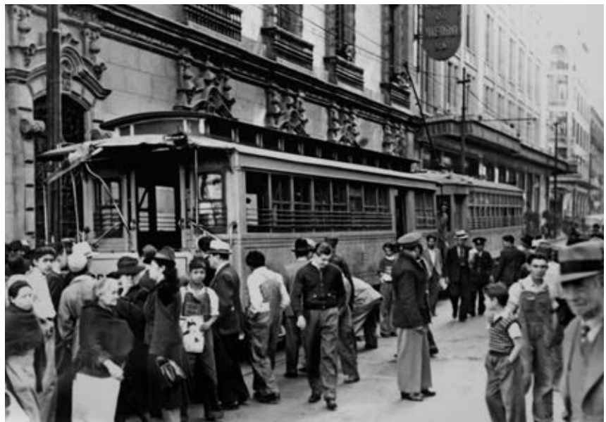
Servicio de tranvías eléctricos en la Ciudad de México en 1930.

Sin embargo, ese milagro tuvo efectos contraproducentes en el funcionamiento de la economía y la sociedad: la industria nacional creció, pero no se invirtió lo necesario en la producción de tecnología y maquinaria pesada, por lo que continuó dependiendo de la importación de ciertos productos que se pagaban con la exportación de otros. De igual manera, la mayoría de las empresas dependían del financiamiento del gobierno, y éste de la inversión y préstamos del extranjero. Al mismo tiempo, la industria requería cada vez menos empleados, lo que provocó un creciente desempleo.