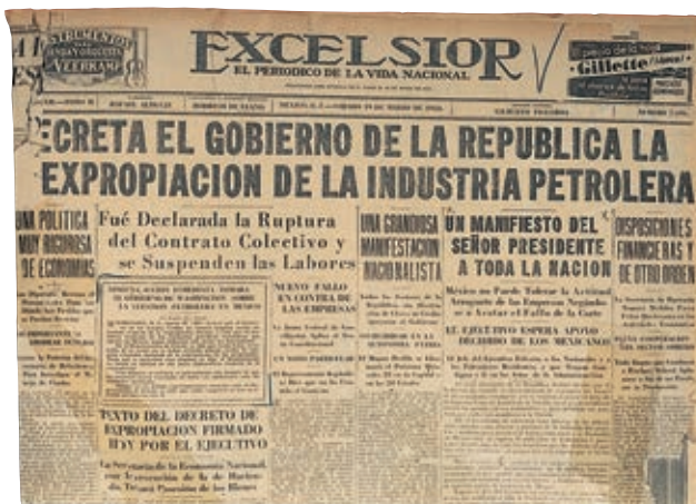
Portada del periódico Excelsior que anuncia la expropiación petrolera.

través de créditos para los ejidatarios y pequeños campesinos. El reparto agrario comprendió también el empleo de maquinaria, así como de técnicas de selección de semillas, rotación e introducción de cultivos, uso de fertilizantes y la creación de institutos, laboratorios y granjas experimentales. De esta forma la agricultura tuvo un papel importante dentro de la producción del país durante el gobierno cardenista.