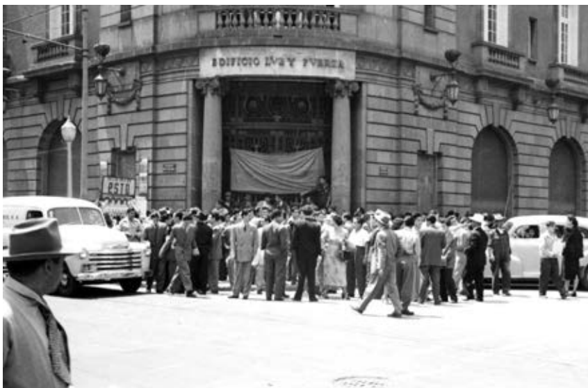
Trabajadores en huelga frente al edificio de Luz y Fuerza, ca. 1950.