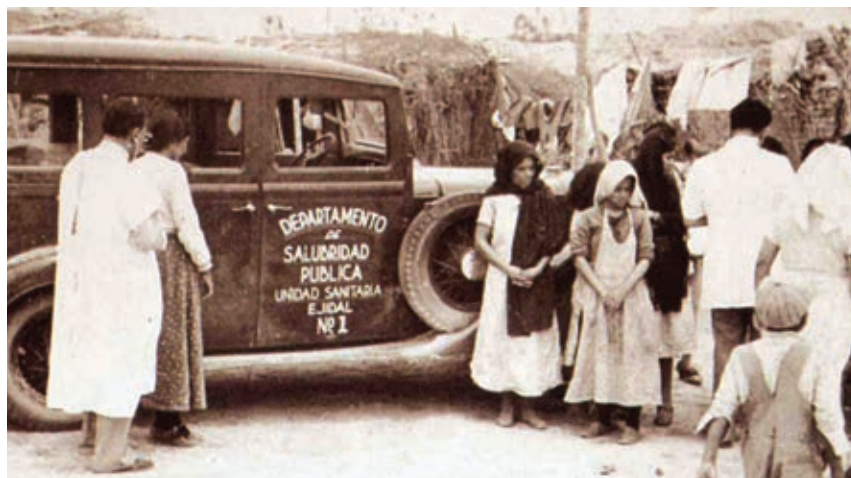
Campaña de salud en la década de los treinta.

Para superar estas y otras dificultades era necesario realizar muchos cambios en la organización del trabajo, la propiedad de la tierra, la distribución de los recursos, las funciones del gobierno, los derechos de los trabajadores y campesinos, la participación de la inversión extranjera, la educación, las condiciones materiales de las poblaciones rurales y urbanas, la explotación de los recursos naturales y otros ámbitos de la economía. Debido a estos problemas, entre 1910 y 1930, la economía mexicana tuvo un crecimiento muy bajo. Poco después, experimentó una mejoría que se prolongó las siguientes cuatro décadas. Causa importante de este crecimiento fueron las reformas e inversiones realizadas en la producción agrícola y en la creación de nuevas industrias.