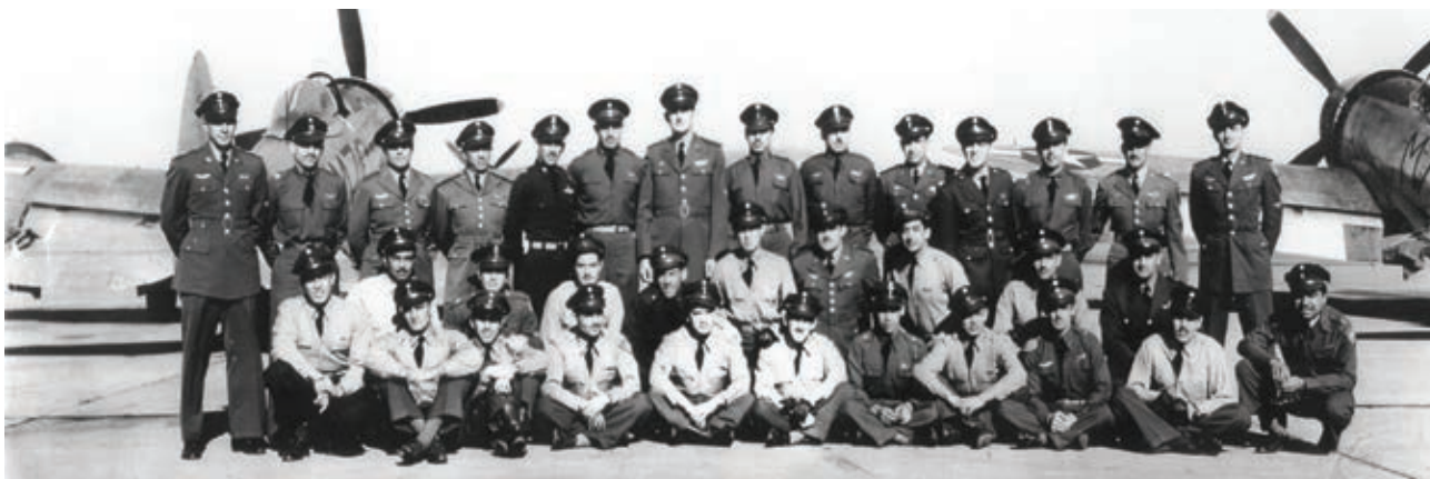
Pilotos del Escuadrón 201 que participaron en la Segunda Guerra Mundial.

Al iniciarse la Segunda Guerra Mundial, México se declaró neutral, pero en 1942, luego de que dos buques petroleros mexicanos fueron atacados por submarinos alemanes, el presidente Manuel Ávila Camacho (1940-1946) decidió apoyar a los países aliados y declaró la guerra a los países del Eje. La participación de nuestro país en esta guerra fue de dos maneras: primero, mediante la