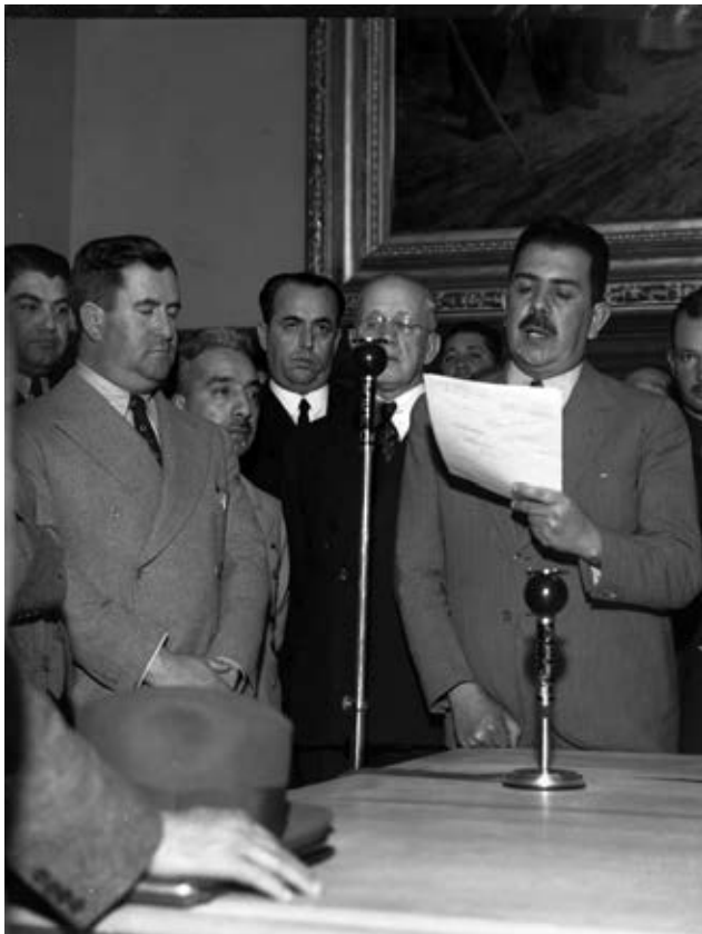
El 18 de marzo de 1938, a través de todas las estaciones de radio de la República, el presidente Lázaro Cárdenas anunció la expropiación de las compañías petroleras.