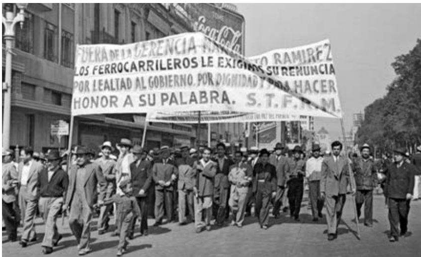
Manifestación de ferrocarrileros, ca. 1952.

Durante el gobierno de Gustavo Díaz Ordaz (1964-1970), el 2 de octubre de 1968 se reprimió violentamente a un enorme mitin estudiantil reunido en la Plaza de las Tres Culturas de Tlatelolco, en la Ciudad de México, en el que se protestaba por los abusos de autoridad cometidos en contra de los estudiantes. Este hecho fue importante para reflexionar sobre la legitimidad del gobierno y la necesidad de buscar otras formas para resolver las demandas sociales.