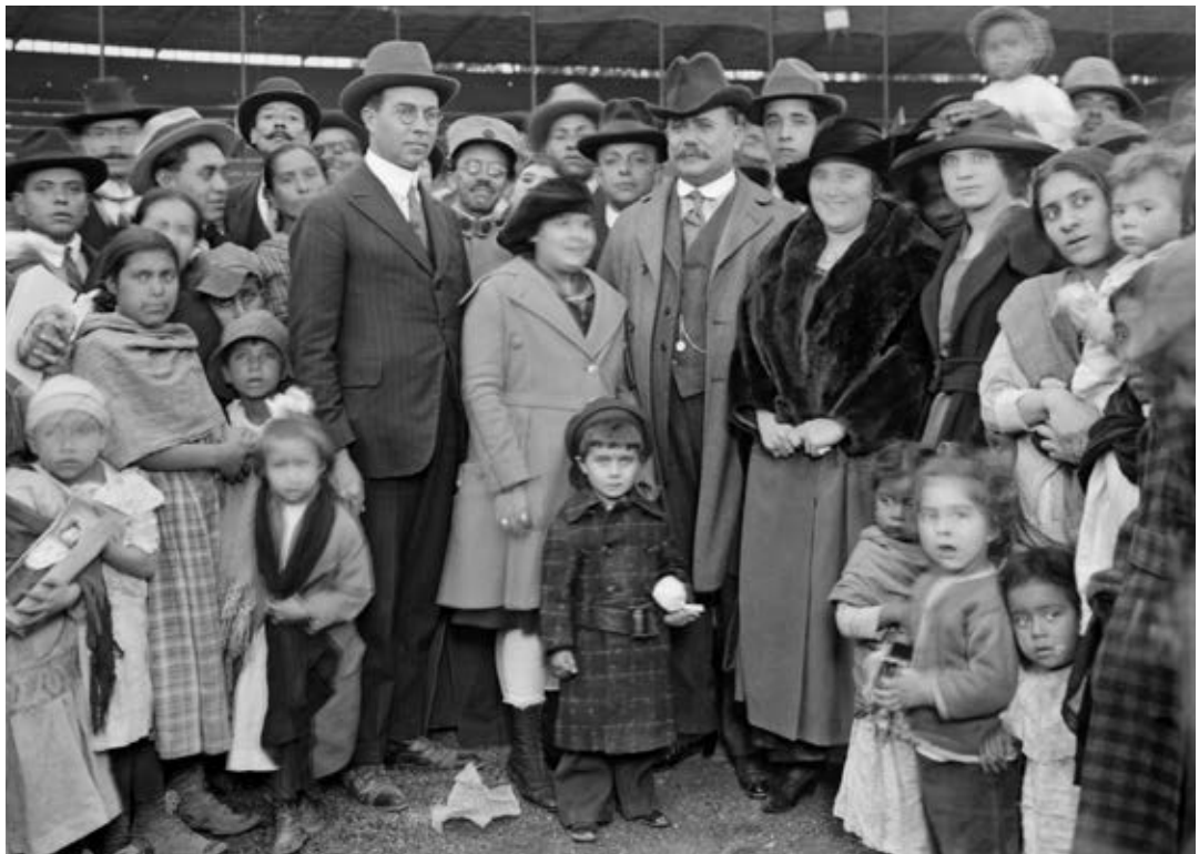
Álvaro Obregón (1880-1928), presidente de México de 1920 a 1924.

El presidente Venustiano Carranza (de 1917 a 1920) tuvo la responsabilidad de inaugurar y poner en funcionamiento el nuevo gobierno. Combatió a opositores, entre ellos a antiguos revolucionarios como Emiliano Zapata, legisladores y gobernadores inconformes con las iniciativas y disposiciones de gobierno. Los campesinos y obreros se inconformaron por la crisis económica que se vivía. Un levantamiento armado desconoció a su gobierno, por lo que Carranza tuvo que huir de la capital y finalmente murió asesinado. Adolfo de la Huerta ocupó de manera temporal la presidencia mientras se realizaban elecciones.