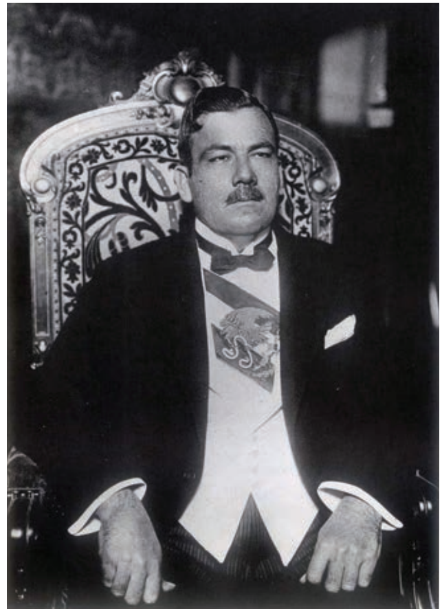
Plutarco Elías Calles (1877-1945) tomó posesión de su cargo como presidente de la República el 1 de diciembre de 1924.

En los últimos dos años de su gestión, enfrentó serios problemas políticos provocados por la guerra cristera y el asesinato del presidente electo Álvaro Obregón. Después de concluir su mandato, entre 1928 y 1934, continuó influyendo en el gobierno a través de sus sucesores. Este periodo es conocido como el Maximato porque, aunque ya no era presidente, Plutarco Elías Calles decidía sobre muchos asuntos, y por ello se le conocía como el Jefe Máximo.