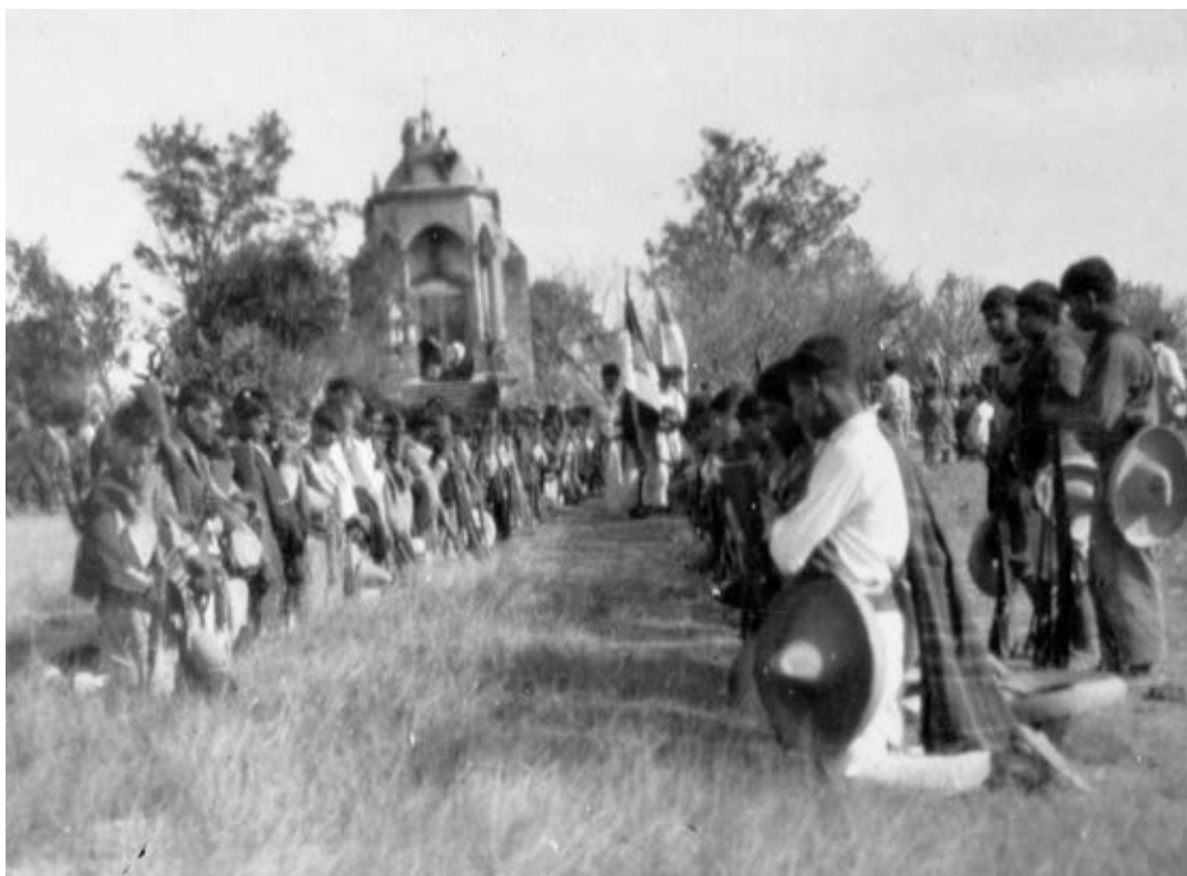
La guerra cristera fue un conflicto armado que se originó durante el gobierno de Plutarco Elías Calles.

Entra al portal Primaria TIC: http://basica.primariatic.sep.gob.mx . En la pestaña Busca, anota Calles rebelión cristera .