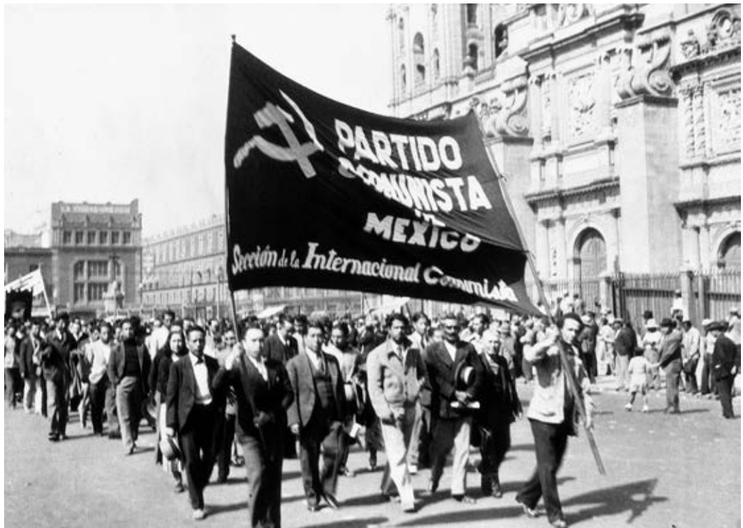
Manifestación de comunistas en la Ciudad de México, 1935.

A pesar del predominio del partido oficial, los partidos de oposición conservaron su importante presencia política en la sociedad. Hubo momentos en que sus candidatos estuvieron cerca de ganar las elecciones presidenciales, como los generales Juan Andrew Almazán en 1940 y Miguel Henríquez Guzmán en 1952. Sus seguidores acusaron al gobierno de haber cometido fraude electoral en favor del PRM y del PRI. Hubo otros partidos de oposición, como el Partido Acción Nacional (PAN), fundado en 1939 por el abogado Manuel Gómez Morín, y el Partido Comunista Mexicano (PCM), creado en 1919. Sólo hasta la década de 1970 la oposición comenzó a ganar algunas elecciones locales. En 1977, Jesús Reyes Heróles, secretario de Gobernación, impulsó una reforma electoral a fin de permitir a los partidos de oposición participar con mayor libertad en los procesos electorales. De esta forma, diputados de diversos partidos se integraron al Congreso.