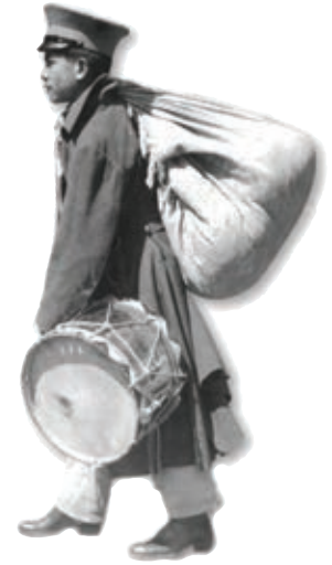
Niño soldado con tambor.

Las ideas de reforma social quedaron plasmadas en el Plan de Ayala y la Ley General Agraria.