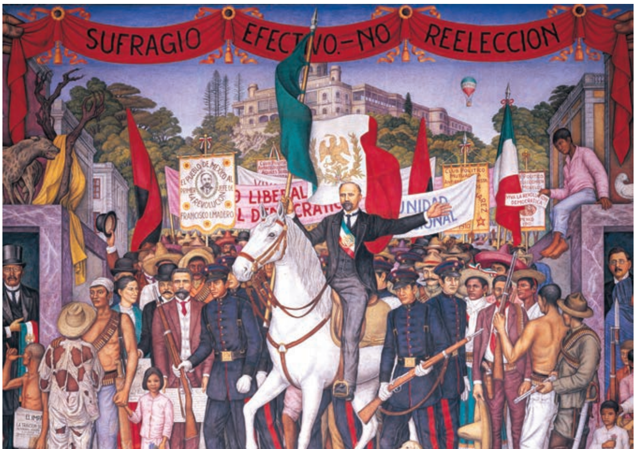
Sufragio efectivo, no reelección , 1968, Juan O'Gorman, Museo Nacional de Historia.