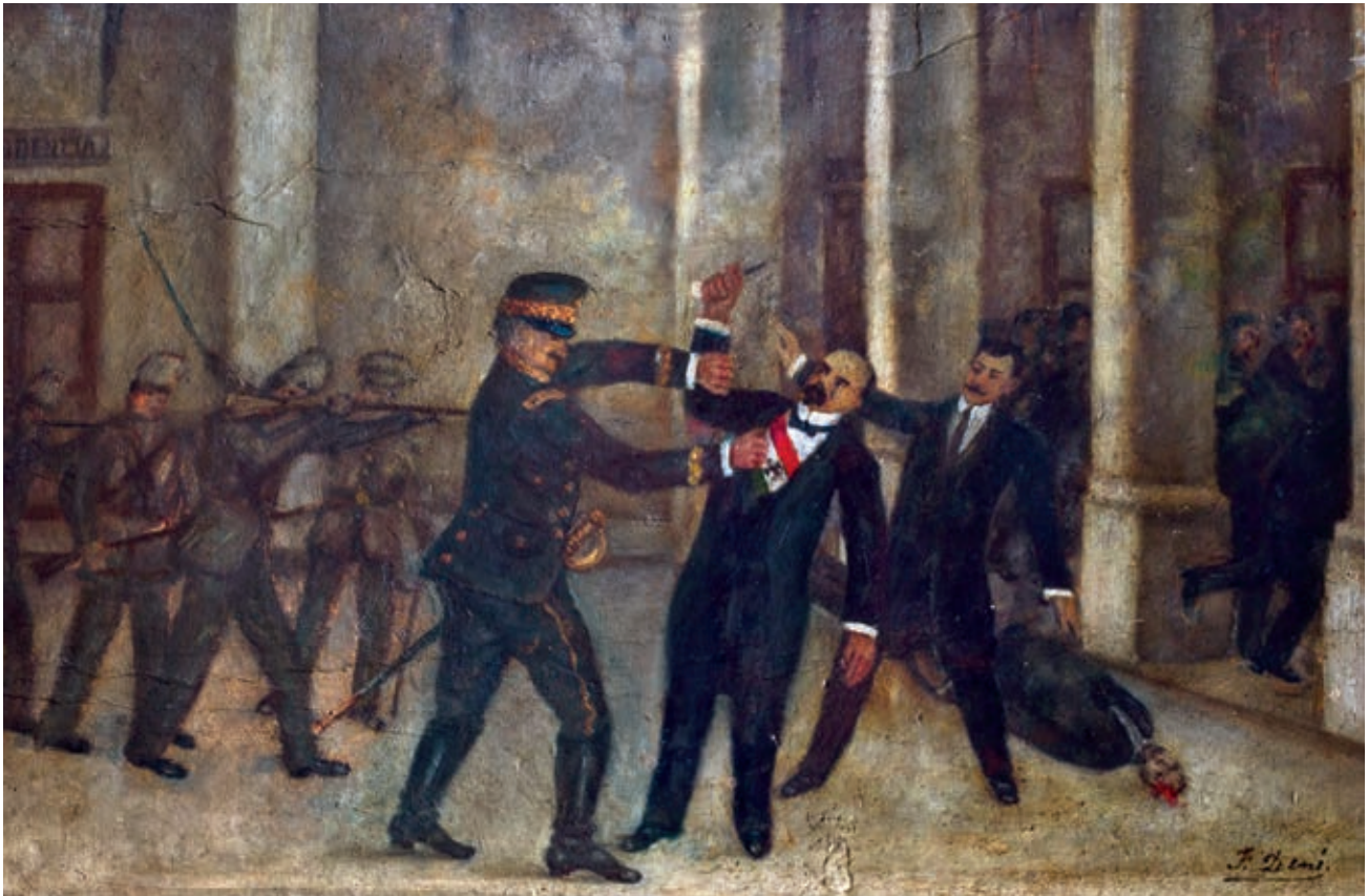
El general Aureliano Blanquet aprehende al presidente Madero y al vicepresidente Pino Suárez (18 de febrero de 1913)

Ante este hecho, Venustiano Carranza, gobernador de Coahuila, elaboró el Plan de Guadalupe, en el que desconocía a Victoriano Huerta como presidente y se autonabraba Primer Jefe del Ejército Constitucionalista, llamado así porque el plan exigía el respeto a la Constitución.