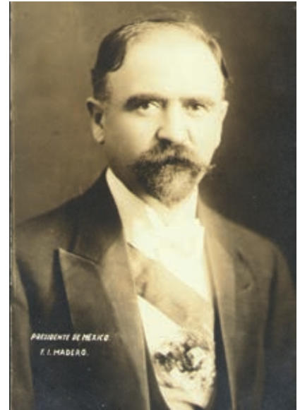
Francisco I. Madero (1873-1913).

Su llamado encontró respuesta en diversas regiones del país: en Chihuahua, con Francisco Villa y Pascual Orozco; en Puebla, con los hermanos Aquiles, Máximo y Carmen Serdán, y en Morelos, con Emiliano Zapata. Para principios de 1911, los levantamientos se extendieron exitosamente por diferentes regiones. En mayo, el general Díaz renunció a la presidencia y abandonó el país, quedando como presidente interino Francisco León de la Barra, quien organizó elecciones libres en las que resultó triunfador Francisco I. Madero, quien gobernó junto con el vicepresidente José María Pino Suárez. Madero trató de gobernar con apego a la ley y respetando las libertades democráticas, sin embargo, enfrentó graves problemas.