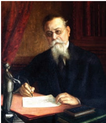
Venustiano Carranza (1859-1920).

Cuando Victoriano Huerta usurpó la presidencia, Venustiano Carranza lo desconoció y se levantó en armas. Lo mismo hicieron los ejércitos de Obregón, Villa y Zapata. Además Estados Unidos se negó a reconocer su gobierno. Ante esto, en agosto de 1914, Huerta dejó el país y Carranza entró triunfante a la Ciudad de México.