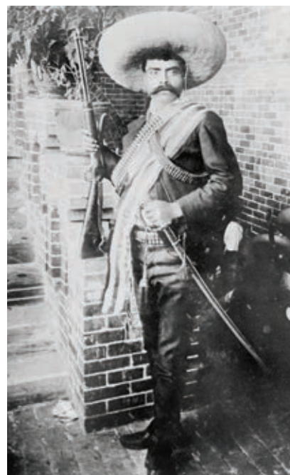
General Emiliano Zapata (1879-1919).

Álvaro Obregón apoyó a Carranza y se sumó al Ejército Constitucionalista, pues coincidía con él en la idea de hacer de México un país próspero y moderno.