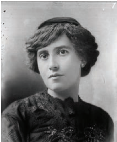
Carmen Serdán (1875-1948).

Algunos de sus partidarios esperaban respuestas inmediatas a las demandas sociales, y al no obtenerlas se alzaron en armas nuevamente, como fue el caso de Emiliano Zapata. Por otra parte, ni los antiguos porfiristas ni los empresarios extranjeros favorecidos por Díaz veían con buenos ojos al nuevo presidente.