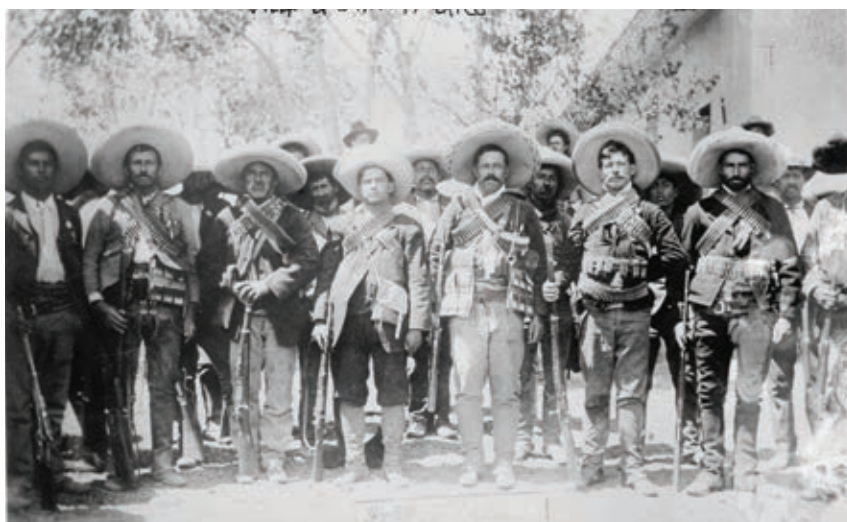
El general Francisco Villa (1878-1923) y su escolta.

Caudillo. Líder que por sus cualidades personales es reconocido como jefe político y militar. A cambio del apoyo y lealtad de sus seguidores, los caudillos realizaban acciones para satisfacer sus demandas.