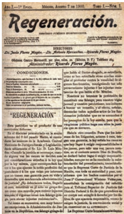
Periódico dirigido por los hermanos Flores Magón.

Una corriente de pensamiento considerada precursora de la Revolución fue el magonismo , encabezada por los hermanos Enrique y Ricardo Flores Magón. Entre sus propuestas planteaban terminar con el reeleccionismo y promover la participación ciudadana. Además, impulsar el mejoramiento y fomento de la educación y de las condiciones de trabajo.