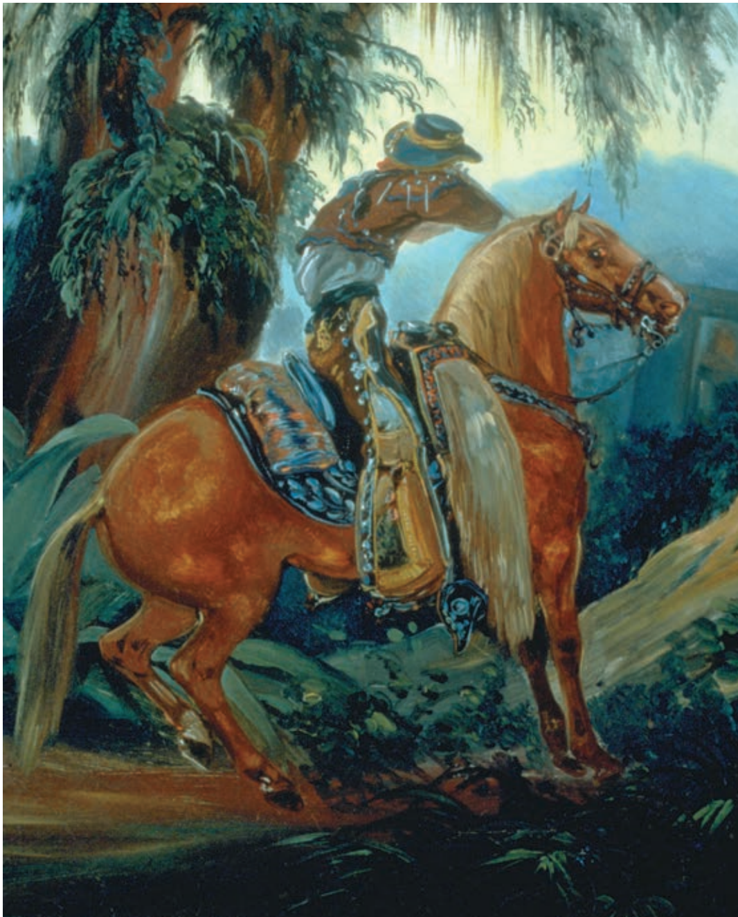
Después de once años de guerra, los caminos del país se encontraban en un verdadero caos. Los bandidos aprovecharon esta situación para hacer de las suyas. Salteador de diligencias , 1831-1833, Juan Mauricio Rugendas, Museo Nacional de Historia.