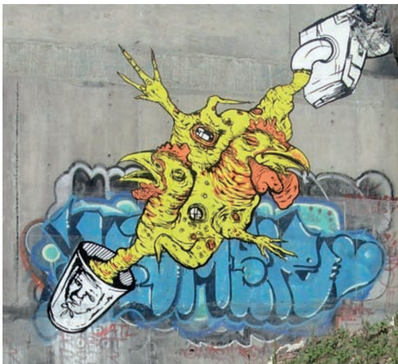
Eyel, sin título, 2008, grafiti, (400 × 400 cm).

Necesitarás música de bailes populares, un reproductor de sonido para el grupo y hacer una investigación sobre lo que bailaban los integrantes de tu familia cuando eran jóvenes. Consigue fotos de bailes populares. Tal vez tus papás te puedan prestar algunas, busca en revistas y periódicos.