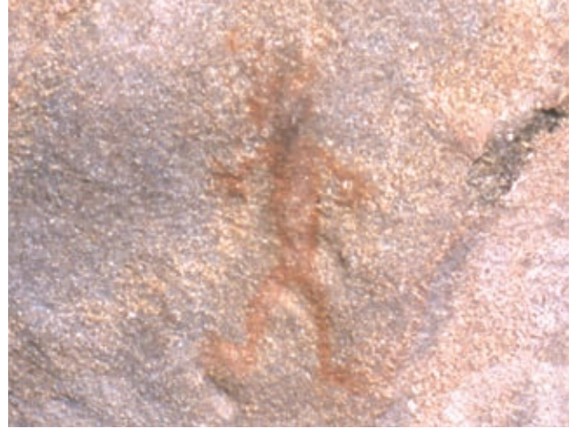
El Diablito , pintura rupestre ubicada en la península de Baja California.

Soporte. Es la superficie donde se realizan dibujos, pinturas o grabados, y puede ser de diversos materiales: tela, papel, piedra, madera, entre otros.