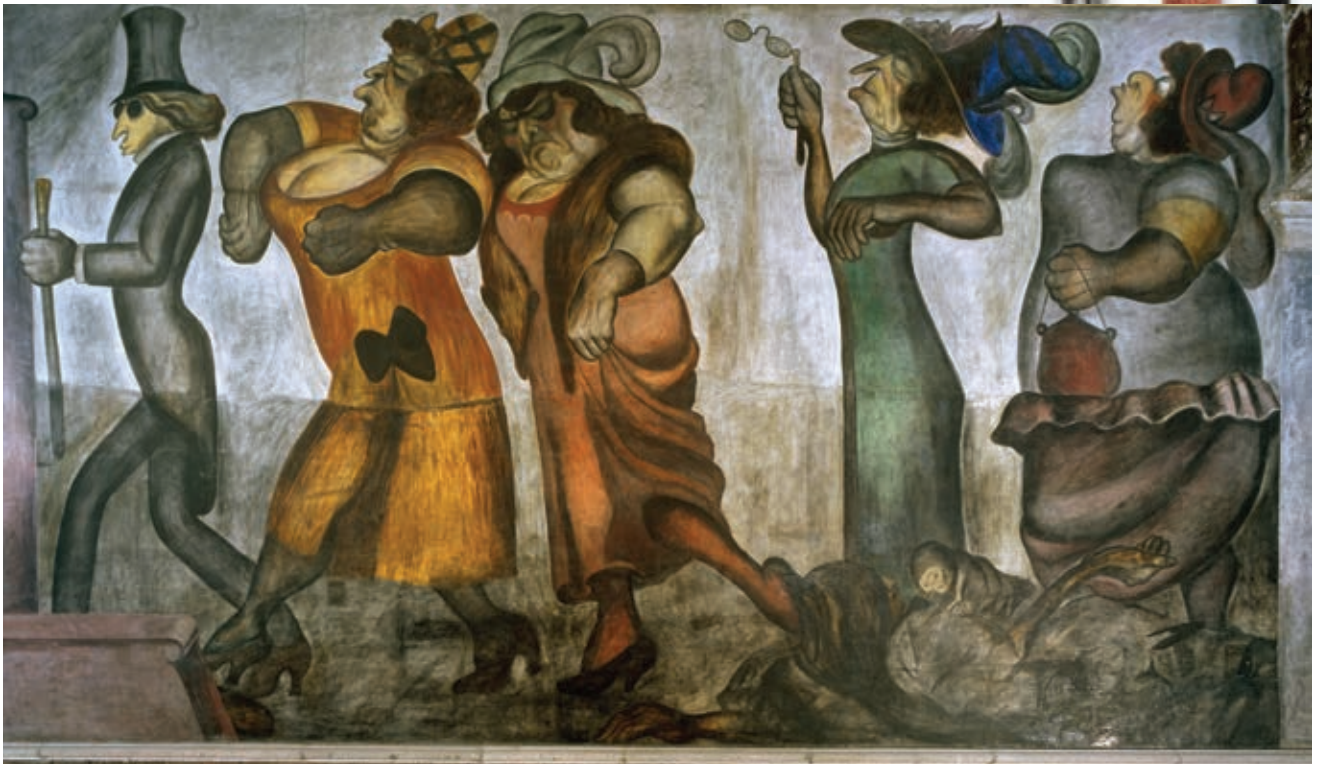
José Clemente Orozco (1883-1949), Los aristócratas (fragmento) 1923-1924, pintura al fresco, (350 × 900 cm aprox.).