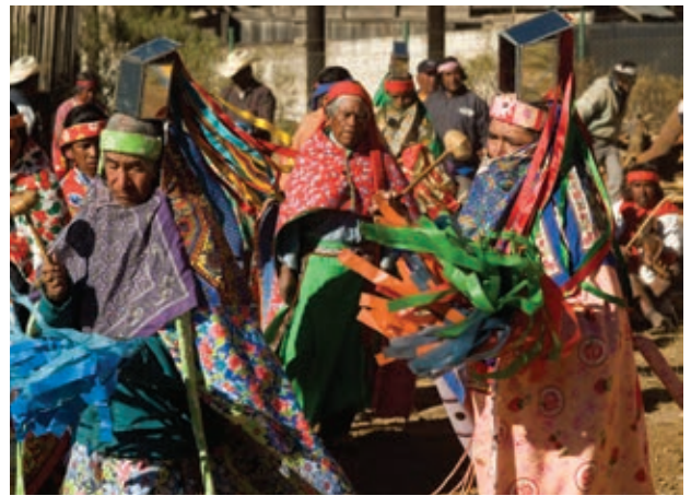
Danza de los matachines, Chihuahua, México.

Danza autóctona o tradicional. Representa los pensamientos y formas de vida de nuestros antepasados, y ha perdurado a lo largo del tiempo gracias a que se transmite de generación en generación. Puede ser ritual o religiosa, por ejemplo, para hacer peticiones agrícolas y de salud, o para dedicarla a una deidad. Un ejemplo en nuestro país es la danza de los concheros.