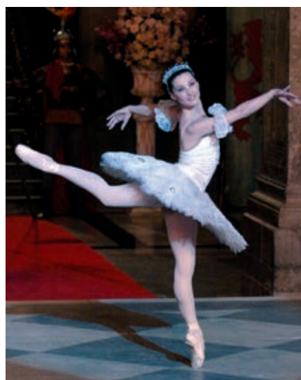
La bella durmiente , Compañía Nacional de Danza.