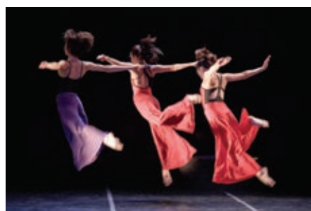
Fragmentos de Carmina Burana , Compañía Fóramen M Ballet.

Comenta con tus compañeros y maestro: ¿qué género atrajo más la atención de tu equipo y por qué? ¿En los otros equipos prefirieron el mismo género que ustedes? Escribe tus conclusiones al respecto.