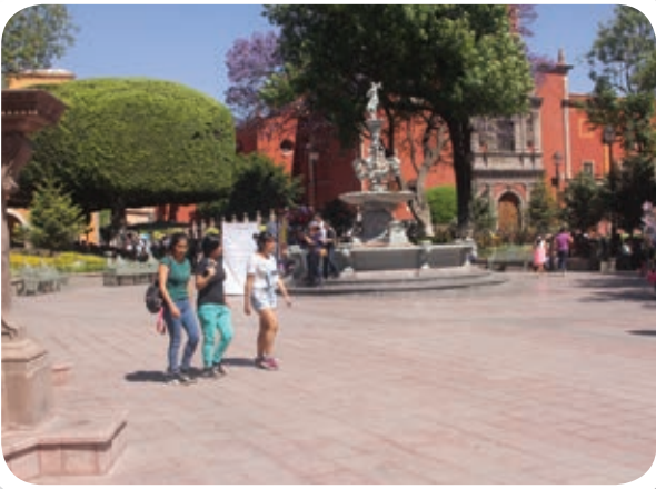
Un día de verano en Querétaro