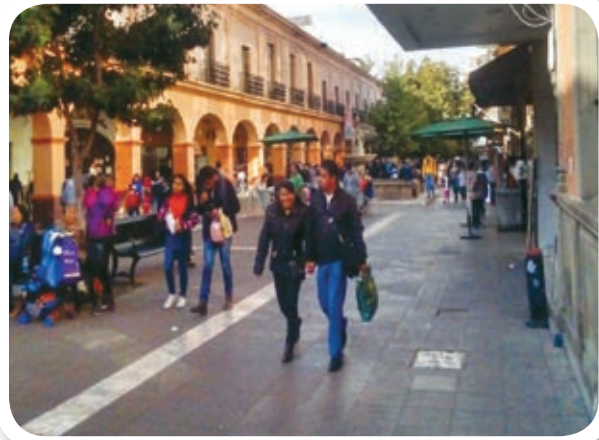
Un día de verano en Toluca