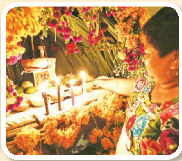
Día de Muertos en Quintana Roo.