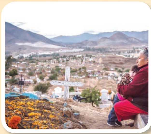
Día de Muertos en Baja California.