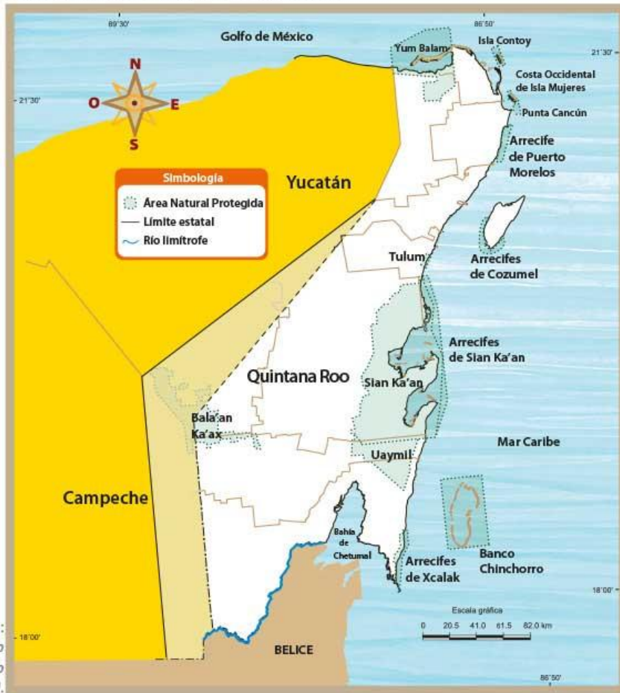
Áreas Naturales Protegidas de Quintana Roo.