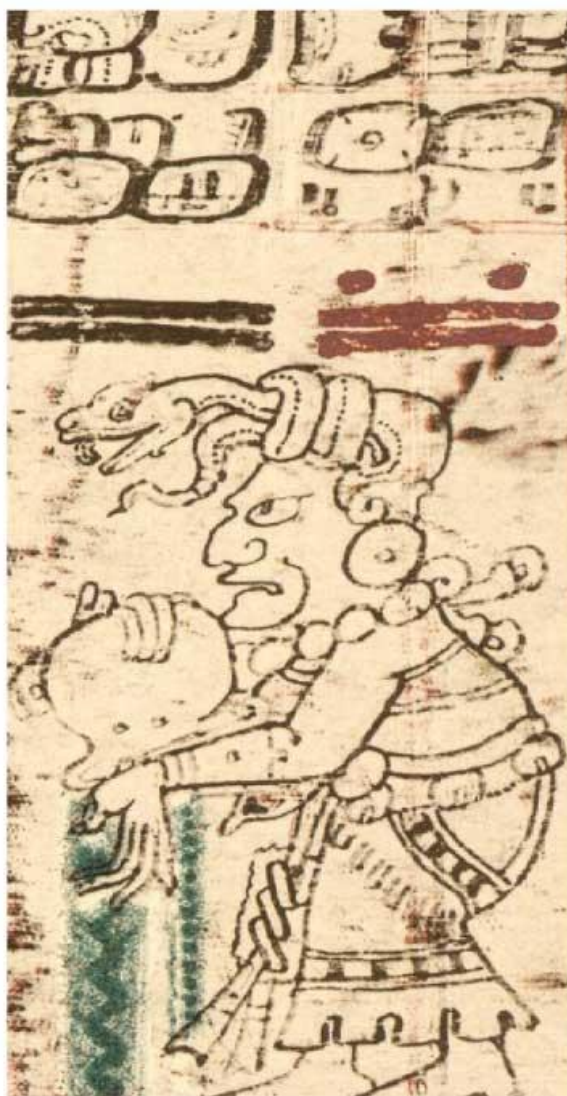
Representación de la diosa maya Ixchel. Códice Dresde.

Con ayuda de un buscador de internet introduce las palabras clave: travesía maya Ixchel y explora para conocer más acerca de este tema.