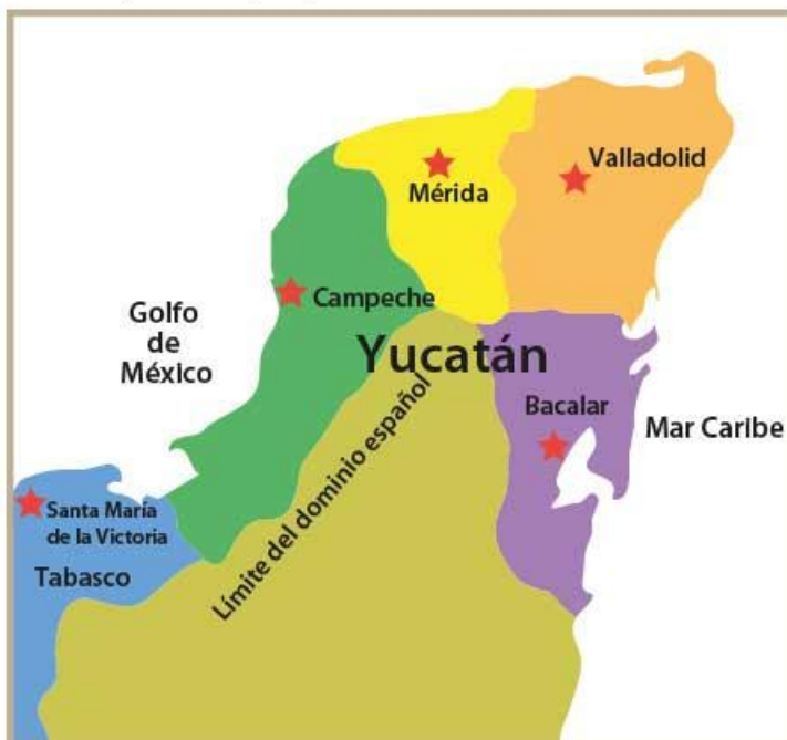
División de la península de Yucatán en municipalidades (1546).

pudo organizarse el gobierno virreinal debido a la ausencia de población maya y española. Por su parte, en Bacalar se organizó un ayuntamiento, pero debido a la escasa colonización española, las autoridades no lograron controlar el territorio, al grado de que los ingleses de Belice invadieron el sur de la municipalidad. De hecho, Cozumel y Salamanca de Bacalar fueron las zonas donde el gobierno español y la Iglesia tuvieron mayores problemas para gobernar y evangelizar a los mayas.