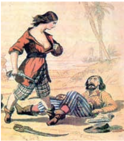
Mary Read, mujer pirata.