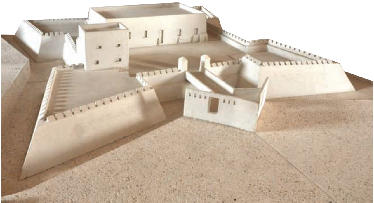
Fuerte de San Felipe, Bacalar.

Con el paso del tiempo, la presencia inglesa se transformó en una alternativa económica. Bacalar quedó convertido en un lugar importante para el comercio entre los pueblos de Yucatán y el puerto de Belice. Los mayas de Peto, Tekax y Valladolid, entre otros, llevaban diversas mercancías como azúcar, gallinas, frutas, cerdos y hamacas. En cambio, los ingleses llevaban artículos manufacturados como mantas y telas. Esta actividad comercial produjo mayor riqueza a los españoles si la comparamos con la pobreza que caracterizó a las antiguas encomiendas.