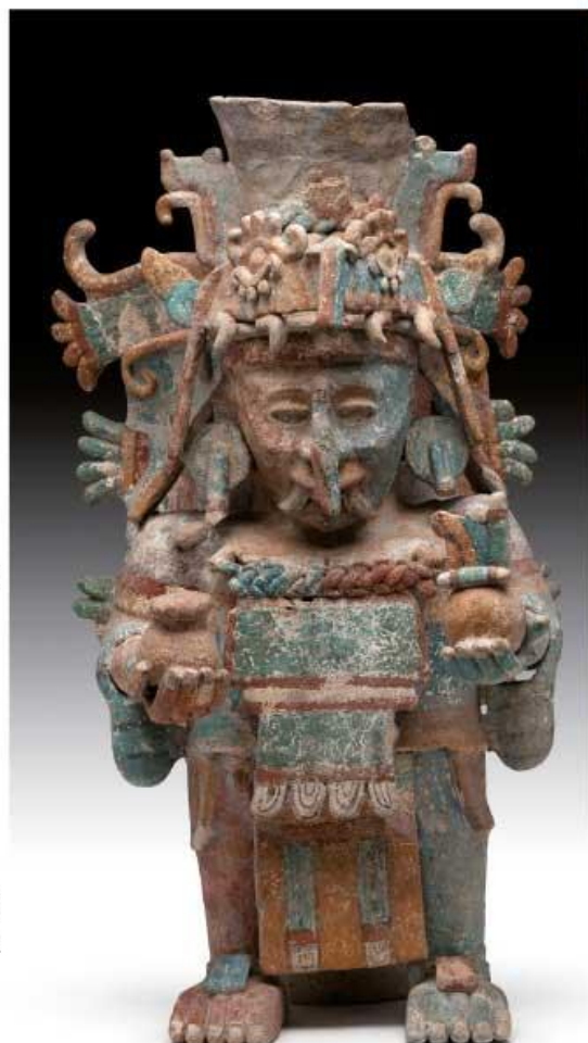
Ser sobrenatural relacionado con la muerte.

Una situación similar se presentó en Cozumel. Durante la etapa prehispánica la isla era un santuario al que acudían mayas de lugares lejanos como Tabasco, Xicalango, Champotón y Campeche, con el fin de adorar a la diosa Ixchel. Había un anciano que llamaban ahk'in (sacerdote), encargado de hablar con la escultura que representaba a su dios y de transmitir la respuesta a los demás mayas. Aun después de la Conquista, hubo un tiempo en que continuaron visitando la isla para celebrar el culto a Ixchel. Esto era posible porque la pobreza de las encomiendas de Cozumel impedía sostener a un cura, ya que los religiosos católicos tenían miedo de realizar la peligrosa travesía de la costa a la isla, pues varias personas se habían ahogado como fue el caso del cura Francisco de Aguirre.