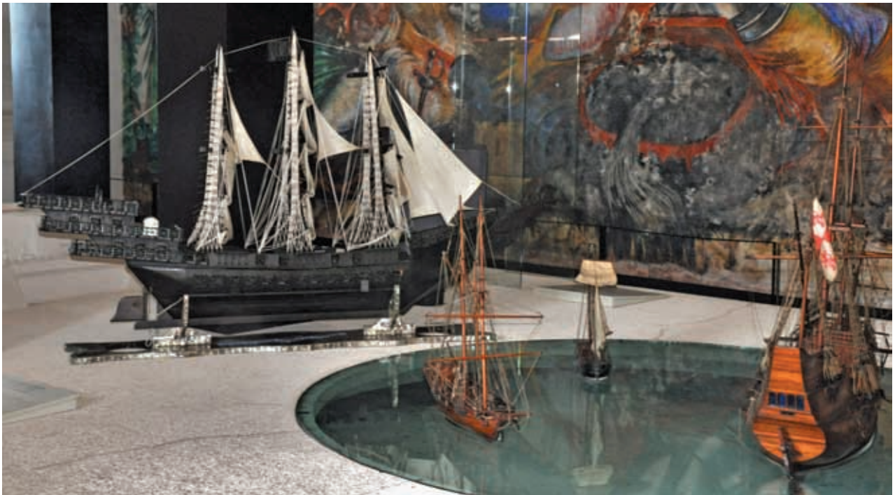
Barco pirata en el Museo Fortaleza de San Felipe, Bacalar.

Al poco tiempo estos piratas se dedicaron al corte de maderas preciosas y del palo de tinte, utilizado para fabricar colorantes para telas. Conforme talaban los árboles avanzaban hacia el norte, hasta que a finales del siglo XVIII ya se encontraban en los montes cercanos al río Hondo.