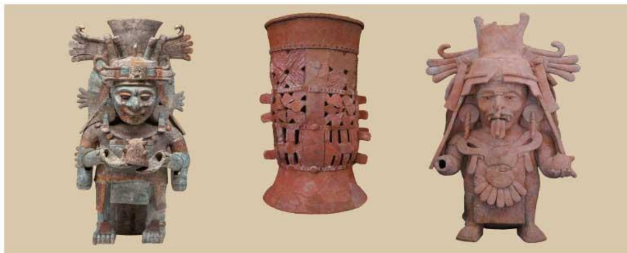
En Bacalar y Cozumel los habitantes mayas adoraban a sus antiguos dioses.