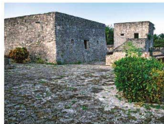
Fuerte de San Felipe, Bacalar.