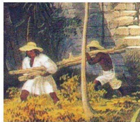
El Castillo en Tulum (detalle), de Frederick Catherwood.