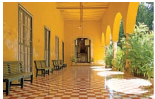
La arquitectura, ejemplo de patrimonio cultural material.