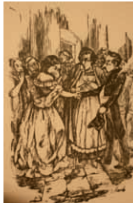
Grabado de Gabriel Vicente Gahona, Picheta , finales del siglo XIX.