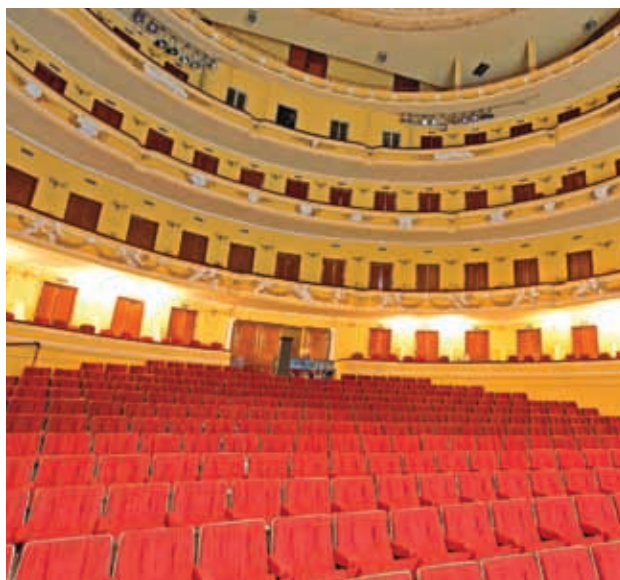
Interior del teatro.