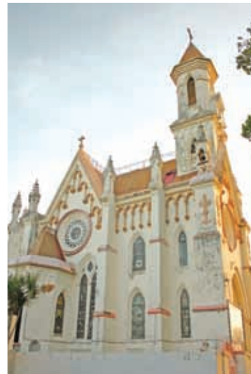
Iglesia del Carmen en Mérida, Yucatán, construida hacia 1904.