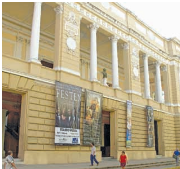
Teatro José Peón Contreras.

Observa las imágenes. ¿Qué opinas de la decoración del Teatro Peón Contreras? ¿Sabes cuándo fue construido? ¿Crees que forma parte de nuestro patrimonio cultural? ¿Por qué?