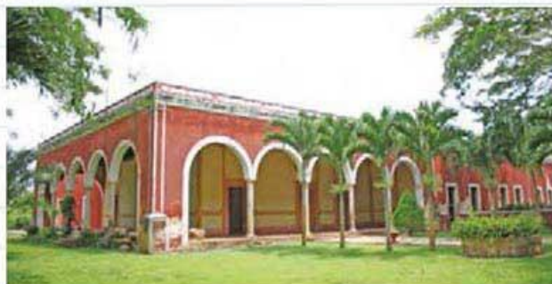
El estilo arquitectónico de un lugar es parte del patrimonio cultural.

Un cartel es una lámina de papel que sirve para anunciar o dar información sobre algo. Está formado por imágenes grandes y un texto breve.