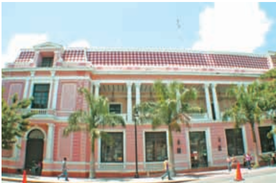
El ex Palacio Federal de Correos, hoy Museo de la Ciudad de Mérida, fue inaugurado en 1908.