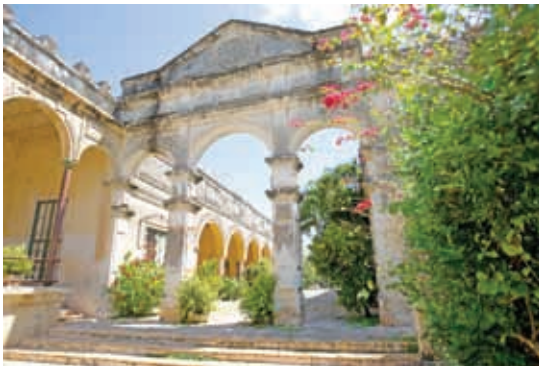
Hacienda henequenera de Yaxcopoil, en el municipio de Umán.

Describe el tipo de manifestación cultural que representan las imágenes y completa las oraciones.