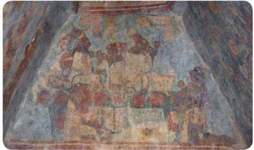
Pintura mural en Bonampak.

A diferencia de los gobernantes y de los sacerdotes, que radicaban en las grandes ciudades, los campesinos mayas vivían en el monte en modestas y bien ventiladas casas, construidas con palos y cubiertas con hojas de palma, pues así se protegían del intenso calor. Este tipo de viviendas aún puede encontrarse en algunos poblados mayas.