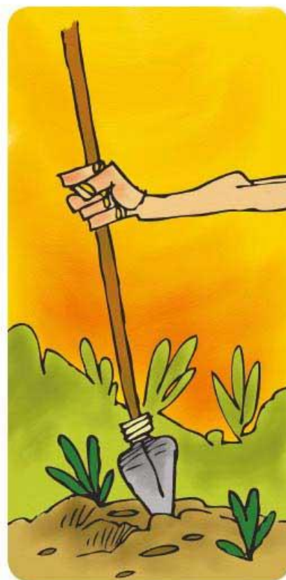
Limpieza del terreno para sembrar maíz.