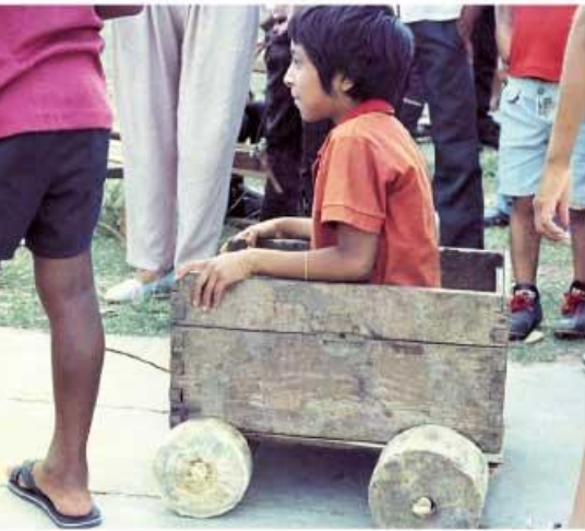
Niños jugando (actualidad).

¿Qué tomas en cuenta para organizar tus actividades diarias? Quizá para responder esta pregunta tienes que considerar tus obligaciones escolares, el tiempo que dedicas al juego, los horarios en que acostumbras ingerir tus alimentos y descansar para reponer energías. Si le preguntáramos lo mismo a un niño maya que vivió hace muchos años en Quintana Roo obtendríamos una respuesta muy distinta a la tuya.