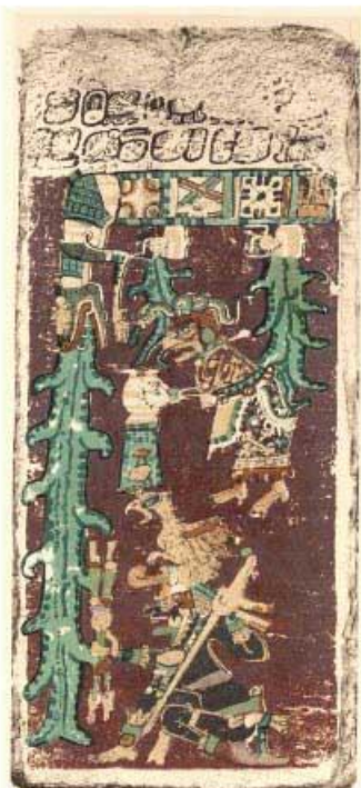
Uno de las páginas del Códice Dresde.

A diferencia de los gobernantes y de los sacerdotes, que radicaban en las grandes ciudades, los campesinos mayas vivían en el monte en modestas y bien ventiladas casas, construidas con palos y cubiertas con hojas de palma, pues así se protegían del intenso calor. Este tipo de viviendas aún puede encontrarse en algunos poblados mayas.