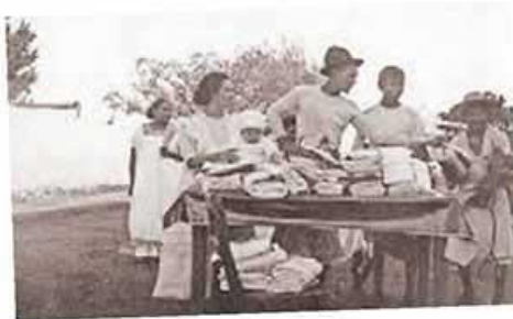
Comerciantes yucatecos rurales en el Porfiriato.