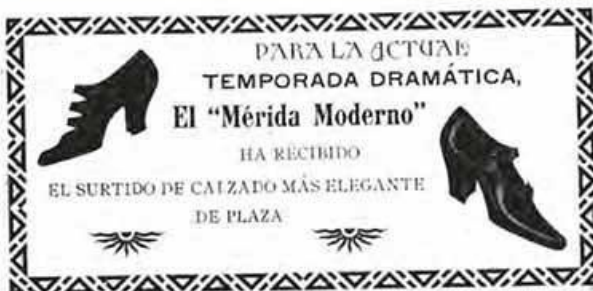
Anuncio publicitario de la época porfiriana.

En 1890 Yucatán tenía más vías férreas que cualquier otro estado del país.