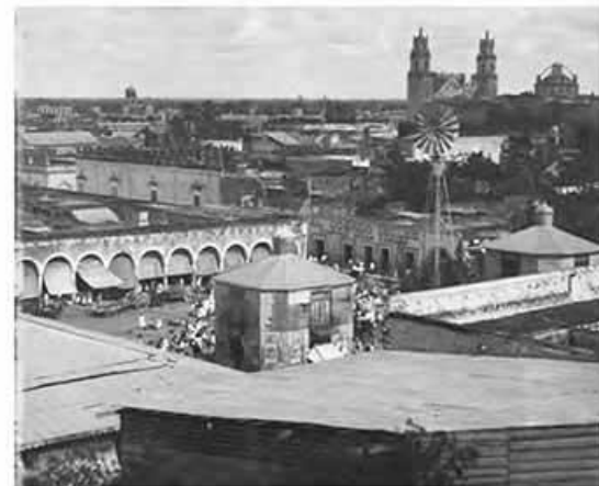
La ciudad de Mérida durante la época porfiriana.