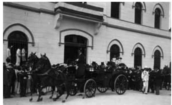
Plaza de Santiago. Mérida, Yucatán, 1906.