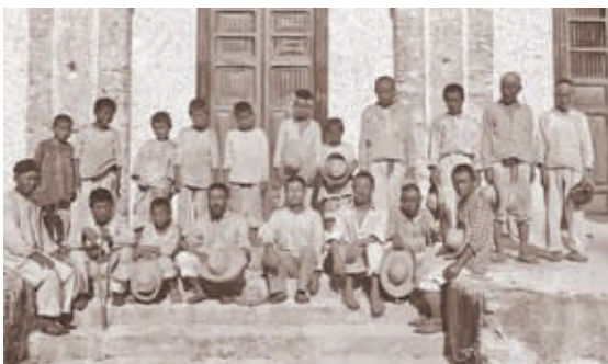
Campesinos en una hacienda henequenera.