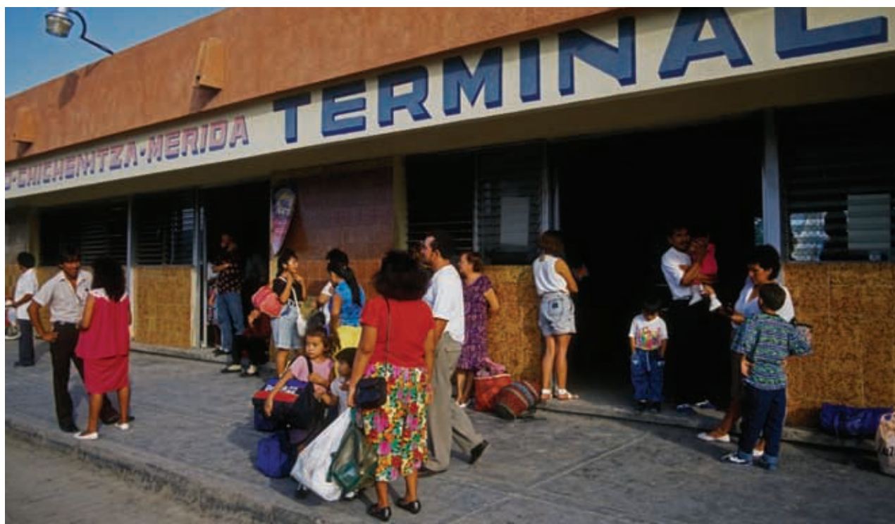
Terminal de autobuses en Cancún.