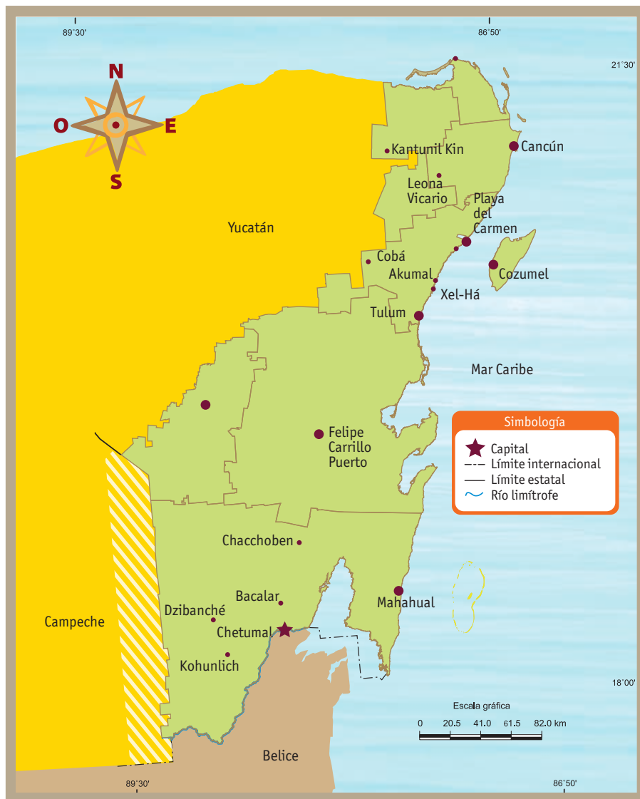
Principales localidades de Quintana Roo.